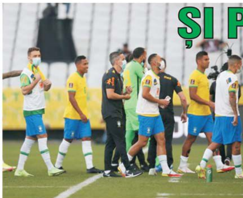
Scena ireală la meciul vedetă din preliminariile CM zona sud-americană Brazilia - Argentina, întrerupt în min. 5 și suspendat după ce poliția sanitară braziliană a venit să scoată din stadion trei jucători argentinieni din motive de COVID 19!

• Concursul Prono-S din 4-5 septembrie, conceput cu partide din preliminariile europene ale CM 2022 din Qatar, a furnizat doar trei câștiguri, unul la categoria a II-a - 5.300 de lei, care a luat drumul Vrancei, și două la a III-a - fiecare a câte 1.320 de lei, toate pe variante jucate "la sfert". În afară de "bomba" explodată la Stockholm, Suedia - Spania 2-1, și surprizele consemnate la Georgia - Kosovo 0-1 și Israel - Austria 5-2 și-au pus amprenta pe omologarea de luni. (E.I.)