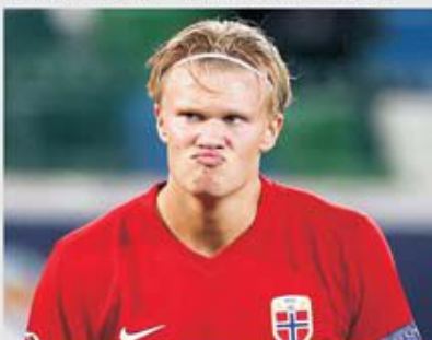
Erling Braut Haaland, a fi sau a nu fi în Turcia

În ultima etapă, Turcia a suferit primul eșec. Și ce eșec: 1-6 la Amsterdam! Şenol Güneş (69 ani) și-a asumat insuccesul: "Sunt singurul responsabil. Nereușita e a mea". Federația l-a demis după trei zile și l-a angajat la 19 septembrie pe Stefan Kuntz (58), cel cu care