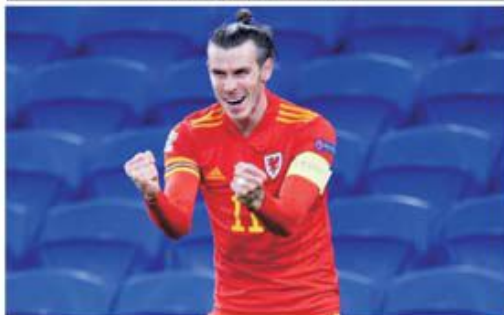
Gareth Bale a semnat toate golurile galeze de la Kazan, Belarus fiind învinsă cu 3-2 la 5 septembrie

Depunerea buletinelor de joc la concursul PRONOSPORT din 11-12 octombrie 2021 se poate face începând de duminică, 3 octombrie, după ora 16,00, și până duminică, 10 octombrie, ora 16,00. Pe buletinele de joc NU SE VA MARCA RUBRICA DA, MIERCURI