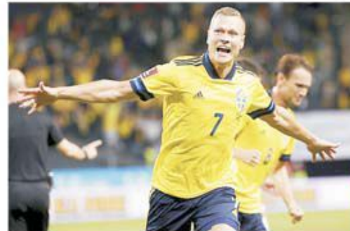
Cu golul înscris în 57', Viktor Claesson a adus victoria Suediei în fața Spaniei (2-1), una dintre surprizele concursului Prono-S din 4-5 septembrie

Depunerea buletinelor de joc la concursul PRONO-S din 8-9 octombrie 2021 se poate face începând de duminică, 3 octombrie, după ora 16.00, și până joi, 7 octombrie, ora 16.00. Pe buletinele de joc SE VA MARCA RUBRICA DA, MIERCURI