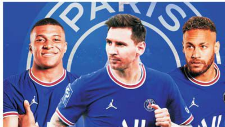
Mbappe - Messi - Neymar, un trio magic doar pe hârtie

pe departe la valoarea lui PSG, cum e Rennes, a făcut dovada că nu este obligatoriu să ai numai vedete ca să devii cel mai bun. PSG este clar un colos cu picioarele de lut și slăbiciunea pleacă tocmai de la zeitățile care ar fi trebuit să poarte pe umeri echipa către cele mai înalte performanțe. Nu puțini sunt cei care spun că a fost o greșală uriașă încăpățănarea șecilor de a-l păstra pe Mbappe, care devine liber vara viitoare și care e clar că s-a mutat cu gândul la Madrid, nu mai vrea să joace la Paris. PSG a refuzat