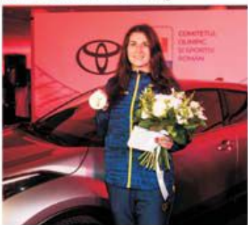
Sports Full Hybrid", automobil al cărui preț pe piață pleacă de la 25.000 de

asteptare". În anul 168 după Eminescu (asta e raportarea corectă a românilor în raport cu Timpul - descoperirea inventivă a aceluiași Preda), în anul centenarului în care România Mare și-a permis respirația sa legitimă de Dacia Felix, eu am avut șansa împlinirii vârstei de 70 de ani, într-un toamnă 27 Septembrie. Ca orice muritor am așteptat ca în raniță să descopăr bastonul de