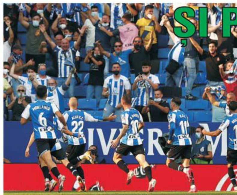
Bucurie fără margini pentru jucătorii lui Espanyol Barcelona după victoria în fața lui Real Madrid. De această dată papagalii nu au mai fost catalanii, ci oamenii lui Carlo Ancelotti

• La fel ca și concursul de mai sus, nici Prono-S din 2-3 octombrie nu a atribuit vreun câștig, la nicio categorie. Așa că fondul de câștiguri de aproape 33.500 de lei se va constitui într-o atractivă bază de plecare pentru următorul concurs, care va cuprinde partide din preliminariile Campionatului Mondial din 2022, Prono-S din 8-9 octombrie. Așadar, semnele vinovate de acest lucru: "1" la Bologna - Lazio, Elche - Celta Vigo, Rennes - Paris St.-Germain, "X" Brighton - Arsenal. (E.I.)