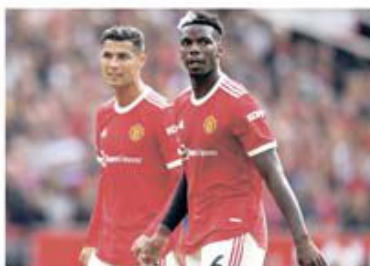
Paul Pogba ar vrea să rămână la Manchester United datorită lui Cristiano Ronaldo

În această pauză cauzată de partidele din preliminariile Campionatului Mondial, conducerea