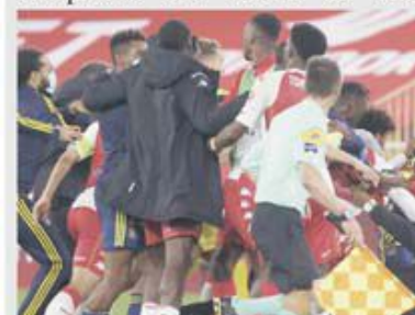
Nu o dată meciurile dintre cele două echipe au avut și suplimente din sporturile de contact, cum a fost la ultimul, încheiat cu cinci cartonașe roșii!

Imediat după pauza prilejuită de partidele din preliminariile CM 2022, în Ligue 1 se va derula etapa cu numărul 9. Unul dintre cele mai interesante meciuri ale rundei, dar și ale weekendului european, se va juca la Lyon între echipa locală și AS Monaco, un duel al unor foste campioane din secolul 21 ale