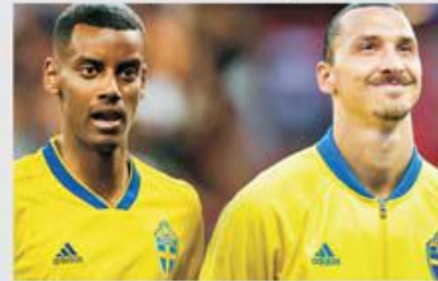
Isak (22 ani), vedetă în devenire, împreună cu deja legendarul Ibrahimovic (40), două piese-cheie din atacul Suediei

Suedia are un avantaj de două puncte în clasament, însă dispută ultimele două meciuri în deplasare, primul fiind în Georgia, unde