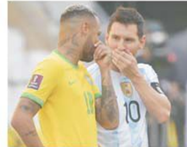
Neymar și Messi se întrețin înaintea ultimului act al Copei Americii din acest an

apar Gabriel Jesus (Manchester City), Vinicius (Real Madrid), Antony (Ajax), Raphinha (Leeds) și Cunha (Atletico Madrid).