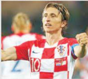
Luka Modric rămâne eminența cenusie a naționalei croate, omul de la care poate veni scânteia de geniu pentru victorie și calificare

a pierdut o singură dată în aceste preliminarii pe teren străin, cu 1-0 în Slovenia, care este o reprezentativă sub cea croată, deci ar fi posibil ca gazdele să poată răsturna această situație defavorabilă la ultimul meci din grupă și să treacă linia la potou înaintea naționalei pregătite de fostul internațional Valeri Karpin. Croatia este o națională foarte greu