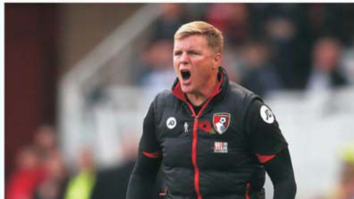
Fostul manager de la Bournemouth, Eddie Howe, a fost numit șef peste coțofene la Newcastle

abia în ianuarie cele 260 de milioane de euro, stabilite ca buget pentru aducerea de jucători de top, vor putea fi cheltuite și nu va fi deloc ușor să convingi nume cu pedigree să vină la un club care e în colaps de puncte și trebuie resuscitat pentru a evita căderea în Championship. Până la aducerea vedetelor care să transforme echipa