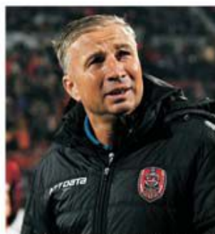
Dan Petrescu a fost oferit de FRF pentru postul de selecționar retrogradare-promovare. Evoluțiile din acest sezon sunt departe de cele din cel prece-

Adversara clujenilor, Jablonec, traversează o perioadă nefastă în campionatul Cehiei. Trupa lui Petr Rada ocupă momentan poziția a 13-a, la doar două puncte distanță de locul ce duce la barajul de