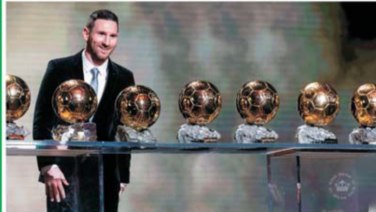
Fără a face mare lucru Leo Messi a intrat în posesia celui de-al 7-lea Balon de Aur din cariera sa

catalană a fost afectată de serioase probleme financiare și nu i-ar mai fi putut asigura salariul anual de 45 de milioane euro. Alegerea lui Messi, care la nivelul fotbalului european a avut un modest, chiar șters, la PSG reușind abia de curând să înscrie primul gol în Ligue 1, dar care a reușit cu naționala Argentinei să ridice trofeul Copei America, a stârnit enorm de multe controverse și indignare.