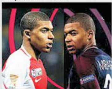
Kylian Mbappe a fost mai întâi săgeata lui Monaco iar acum este killerul de serviciu la PSG inclusiv în meciurile directe

Niko Kovac, cel care a reușit performanțe frumoase cu Bayern Munchen, dar care nu reușește să dirijeze pe al-roșii spre podium. În lot se regăsesc jucători de top, precum germanul Volland, veteranul spaniol Fabregas, rusul Aleksandr Golovin sau internaționalul francez, căpitanul echipei, Ben Yedder.