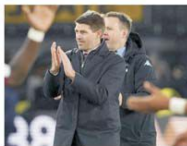
Steven Gerrard se întoarce ca adversar pe stadionul lui Liverpool

Liverpool a avut o posesie zdrobitoare pe Molineaux, însă mingea s-a încăpățânat să intre în poartă în ciuda numeroaselor ocazii. O șansă rarisimă a avut portughezul Jota în minutul 60. Jose Sa, portarul gazdelor, a ieșit hazardat dintre buturi, nu a comunicat cu Saiss, iar mingea a ajuns la lusitanul lui Jurgen Klopp. Jota a avansat cu mingea la picior până în careul mic, moment în care avea în față doi fundași ai lui Wolves pe linia porții, dar spațiu suficient în ambele colțuri încât să marcheze fără probleme. Inexplicabil, Jota a ținut capul în pământ și a șutat direct în Coady! "Cormoranii" au așteptat până în minutul 90+4 pentru a da golul victoriei. Salvatorul lui Liverpool s-a numit Divock Origi! Belgianul, intrat în minutul 68, a înscris după o pasă a lui Salah. Pentru partida cu Villa, Klopp nu se va putea baza pe accidentații Firmino, Gomez, Jones, Elliott și Keita.