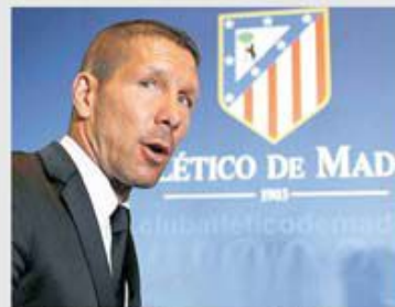
Atletico poartă amprenta lui Simeone din 23 decembrie 2011

"Madrid - Atletico" va fi inserat în titlurile premergătoare din presa spaniolă în ceea ce privește meciul etapei a 17-a, programat duminică, 12 decembrie, de la ora 23.00. Intitulat "El Derbi Madrileño", cel mai important meci între echipe din capitala Spaniei a ajuns la episodul 169 în campionat - 89-40-39 293-217 pentru Madrid, și 227 în toate întrecerile oficiale - 112-59-56 374-282, tot pentru Madrid.