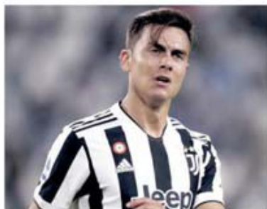
Acest sezon poate fi ultimul pentru Paolo Dybala în tricoul lui Juventus

înțelese de mai mult timp cu Juventus pentru prelungirea contractului, dar fără să semneze noua înțelegere. Cele două părți au tot amânat să facă anunțul oficial deoarece, între timp, torinezii s-au răzgândit asupra unor termeni. Inițial, conducerea clubului i-a propus un salariu de 8 milioane de