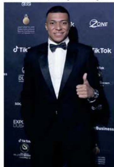
Kylian Mbappe, cel mai bun fotbalist din 2021

După trofeul acordat anual de bisăptămânalul France Football pentru cel mai bun jucător care evoluează în Europa, al doilea trofeu ca importanță este cel acordat la Gala Globe Soccer, în Qatar, un trofeu cu istorie recentă și care premiază pe cel