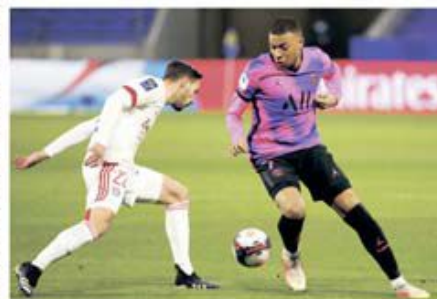
Lyon - PSG poate oferi un meci cu goluri, în care starul parizian nu e nici Messi, nici Neymar, ci Kylian Mbappe

suporterii celei mai puternice echipe din Franța nu sunt încântați de evoluția unei echipe cu inflație de staruri. Mult lăudatul trio Neymar - Mbappe - Messi e doar pe hârtie, pentru că brazilianul ori e accidentat, ori joacă doar pentru el, iar Messi nu a arătat la Paris nici zece la sută din clasa de la Barcelona. Dacă acest trio ar fi funcționat la maxim ar fi fost un