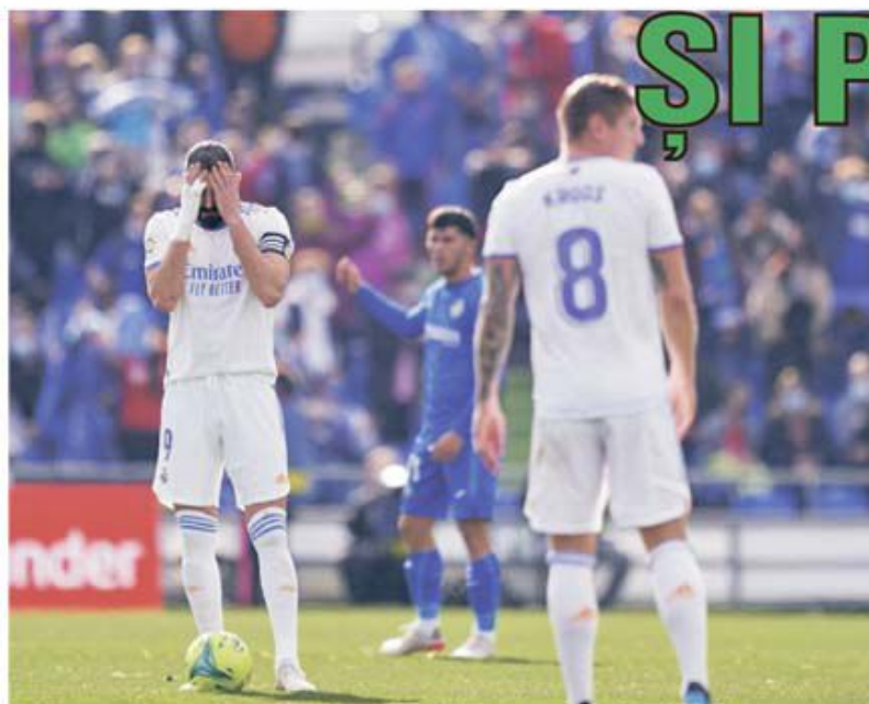
După 15 etape de invincibilitate liderul din La Liga, Real Madrid, a capotat. A făcut-o la primul meci din 2022, pe terenul concitadinei Getafe, scor 1-0, producând prima mare surpriză în noul an și la concursul Prono-S

● Cu semnul "1" la Getafe - Real Madrid și "2" la Valencia - Espanyol și la Almeria - Cartagena, ultimul fiind meci din Segunda Divison, era foarte puțin probabil ca Prono-S din 1-2 ianuarie să producă variante câștigătoare cu 13 rezultate exacte. Însă omologarea a consemnat report la toate cele trei categorii, astfel că întreg fondul de câștiguri - peste 27.500 de lei!, se reportează și se constituie în baza de pornire pentru următorul concurs, cel din 8-9 ianuarie. (E.I.)