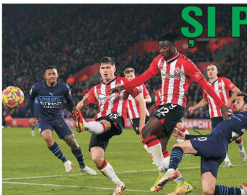
Cu sfinții nu e de glumit! S-a convins de acest lucru și Pep Guardiola cu Manchester City, care nu a putut face decât două egaluri cu Southampton în acest sezon: 0-0 în tur acasă și acum 1-1 în deplasare.