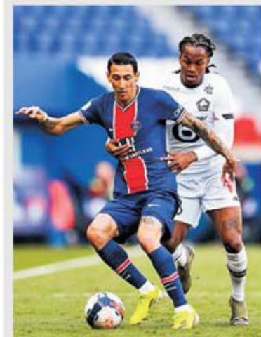
Sezonul trecut Lille lua șase puncte lui PSG și câștiga spectaculos titlul în Ligue 1. A sosit acum momentul revanșei?

Lille – PSG este meciul vedetă al etapei cu numărul 23 din Ligue 1. Meciul va avea loc duminică, 6 februarie, de la ora 21:45, pe stadionul Pierre Mauroy, care poartă numele fostului primar al orașului în perioada 1973 – 2001,