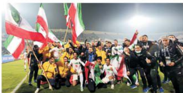
Iran e prima națională din Asia care sărbătorește prezența la Mondial

pentru că nu obține decât dreptul de a merge la confruntarea finală, tot în două meciuri, cu ocupanta locului 5 din America de Sud, ceea ce, să recunoaștem, este o misiune grea, pentru că poate da peste Columbia, Uruguay sau Peru. Un lucru e sigur după încheierea etapei a 7-a a grupelor finale.