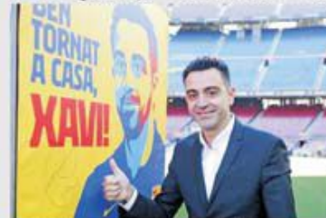
Xavi pare să fie soluția potrivită pentru reabilitarea Barcelonei

notăm că Barcelona nu a mai triumfat în ultimele cinci confruntări cu formația madrilenă (0-2-3 4-8), una fiind în semifinalele Supercupei Spaniei, 2-3 la Jeddah (Arabia Saudită, 9 ianuarie 2020), atunci când Messi și Griezmann, acum la PSG și... Atletico, înscriau pentru învinși.