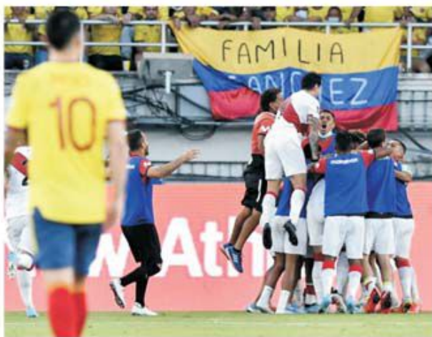
Victoria peruanilor în Columbia a complicat și mai mult ecuația calificării directe de pe locul 4

Ne apropiem pas cu pas de finalul campaniei de calificare din zona Americii de Sud. Am ajuns la etapa a 15-a și mai sunt de jucat 270 de minute până când vom afla numele ultimelor două echipe calificate direct pentru Qatar 2022 și ce echipă națională va merge la barajul cu învingătoarea locurilor 3 din cele două grupe finale ale Asiei. Doar două, pentru că Argentina și Brazilia mai așteaptă doar pe deplin relaxate tragerea la sorți a grupelor turneului final, pentru a ști unde trebuie să își rezerve locația, fiind deja calificate încă de acum două luni. În urma rezultatelor înregistrate în etapa a 15-a, lucrurile nu s-au simplificat cu nimic, ba, dimpotrivă, s-au complicat pentru că Peru a obținut o uriașă victorie în Columbia și a urcat pe locul 4, iar învinsa