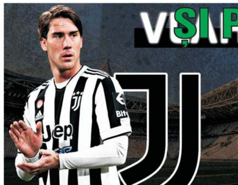
Dušan Vlahovic pare a fi transferul nr.1 efectuat de marile cluburi în perioada de mercato de iarnă. Juventus va plăti Fiorentinei 67 de milioane euro plus bonusuri pentru atacantul sârb, unul dintre cei mai prolifici din Europa la acest moment.