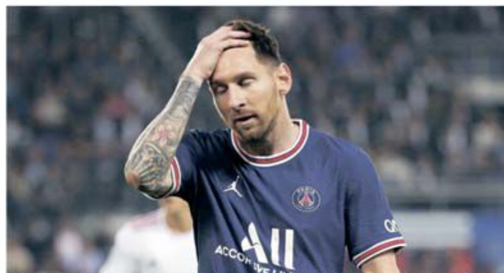
Leo Messi este gata să renunțe la munții de bani de la PSG pentru a-și regăsi zămbetul acasă, la Barcelona

urmă inevitabilul s-a produs, dar fanii lui PSG sunt șocați și au impresia că la Paris a ajuns o clonă sau o sosie a magicianului care ridică 90.000 de oameni în picioare pe Nou Camp. Au avut parte de latura întunecată a argentinianului, departe de tot de ceea ce arătase de nenumărate ori. Și, culmea, după