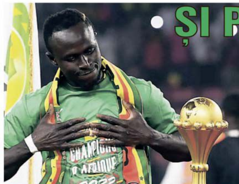
Finala Cupei Africii a adus față în față doi colegi și prieteni, cei mai buni jucători de la Liverpool. Avea să rădă după dramatica serie de lovituri de departajare care a decis trofeul senegalezul Sadio Mane, care a și transformat lovitura decisivă, în fața egipteanului Mohamed Salah.