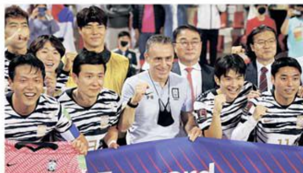
"Tigrii Asiei", pregătiți din august 2018 de portughezul Paulo Bento, vor merge la turneul final pentru a 10-a oară consecutiv

În cealaltă grupă, situația este mult mai complicată în privința celor două reprezentative care se califică direct la regalul fotbalistic din Qatar. Cel mai dificil program îl are Australia, care