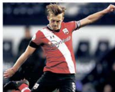
Mijlocășul lui Southampton, James Ward-Prowse, este unul dintre cei mai buni executanți de lovituri libere din lume

Manchester United - Southampton sau, mai simplu, „Diavolii” versus „Sfinții”, este un clasic al fotbalului englez. Partidele dintre cele două formații au fost mai mereu spectaculoase, iar faptul că United este favorită pe hârtie nu s-a văzut mereu și pe gazon.