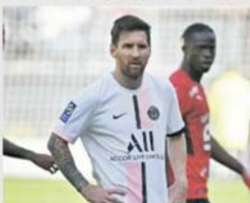
PSG a suferit singurul eșec din acest sezon la Rennes. Fața lui Lionel Messi exprimă stupefacția după acest insucces

defilează la pas spre o nouă coroană a Franței. Rennes se menține în zona europeană, cel mai probabil cu șanse de a prinde un loc în Europa League sau Conference League, pentru că deja există un decalaj destul de pronunțat față de Nice și Marseille, principalele candidate la Champions League. A realizat și o afacere notabilă vara