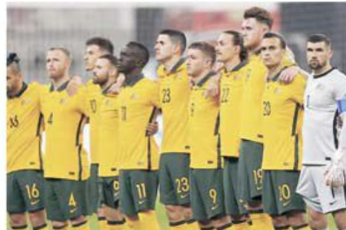
Reprezentativa Australiei va încerca să se califice pentru a cincea oară la rând la un turneu final de Cupă Mondială