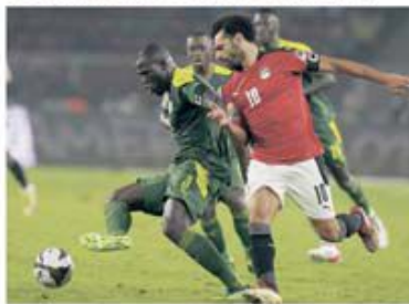
Întâlnirile dintre Egipt și Senegal garantează întotdeauna spectacolul

Așadar, selecționata „leilor din Teranga” a câștigat pentru prima dată în istorie Cupa Africii pe Națiuni. Senegalezii mai jucaseră două finale, în 2002 și 2019. De partea cealaltă, Egiptul a pierdut pentru a treia oară în ultimul act, după edițiile din 1962 și 2017. Naționala „faraonilor” rămâne totuși cea mai titrată echipă din această competiție, cu șapte succese, două mai multe decât Camerun.