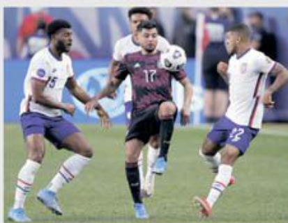
Întotdeauna meciurile dintre mexicani și americani au mirosit a praf de pușcă

În fotbalul din America de Nord și Centrală ani de zile a existat o singură echipă care era regina absolută: Mexicul. Dar începând cu anii 1990 SUA nu a mai vrut să fie doar o prezență de culoare care să genereze când și când cutremure de proporții, cum a fost înfrângerea Angliei în 1950, și a pus bazele unui campionat profesionist, care a ajutat foarte mult la transformarea fotbalului într-un sport cu mult mai mare audiență pe un teritoriu unde baschetul, hocheiul și fotbalul american nu aveau rivali. SUA a