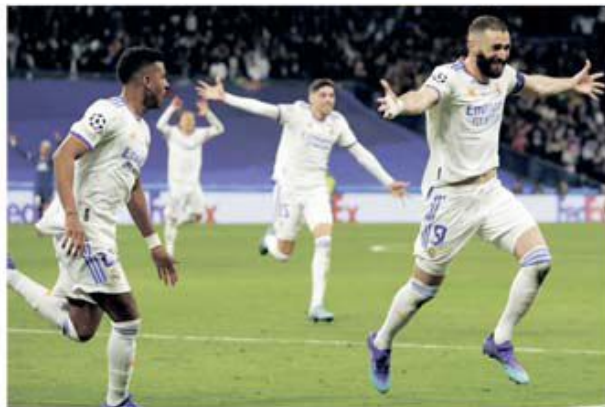
Real Madrid a pus la respect miliardarii de la PSG

și-a desemnat cele opt participante la sferturile de finală. Devine o afacere anglo-spaniolă, pentru că Premier League și la Liga merg mai departe cu trei echipe, celelalte două provenind din Germania și din Portugalia. Dintre formațiile cu blazon nobiliar au căzut Manchester United și Juventus, celor două alăturându-li-se un PSG care în fiecare an visează trofeul, dar numai acum doi ani chiar a jucat cu el pe masă, fără a-l atinge. E adevărat că deși sunt câte trei echipe din Anglia și din Spania nu poți să nu iei în calcul pentru câștigarea trofeului pe Bayern Munchen, la această oră una dintre cele mai bine puse la punct mașinării din fotbalul euro-