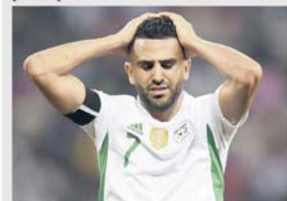
Ryad Mahrez, starul algerian de la care se așteaptă foarte mult, e în vizorul fanilor pentru randamentul său slab din ultima vreme

Camerun - Algeria este unul dintre cele mai echilibrate meciuri din cele cinci partide din baraje de pe continentul negru. Ambele au participări la turneele finale de CM