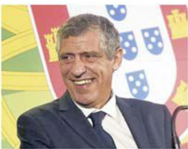
În 2015, Fernando Santos declara: "Portugalia poate să câștige Euro 2016"

Turcia a ocupat și ea locul 2, în Grupa G, după Țările de Jos, dar înaintea Norvegiei și Muntenegrului. Dacă nu remiza