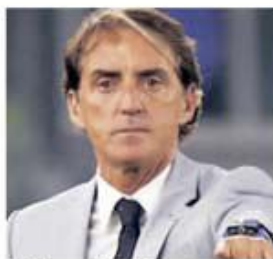
Roberto Mancini nu concepe ca Italia să lipsească din Qatar

duela cu ocupanta locului 5 din preliminariile sud-americane, la 13 sau 14 iunie, în Qatar. De notat că selecționerul olandez Bert van Marwijk a fost demis după ultimul meci, 0-1 în Iran, și înlocuit cu