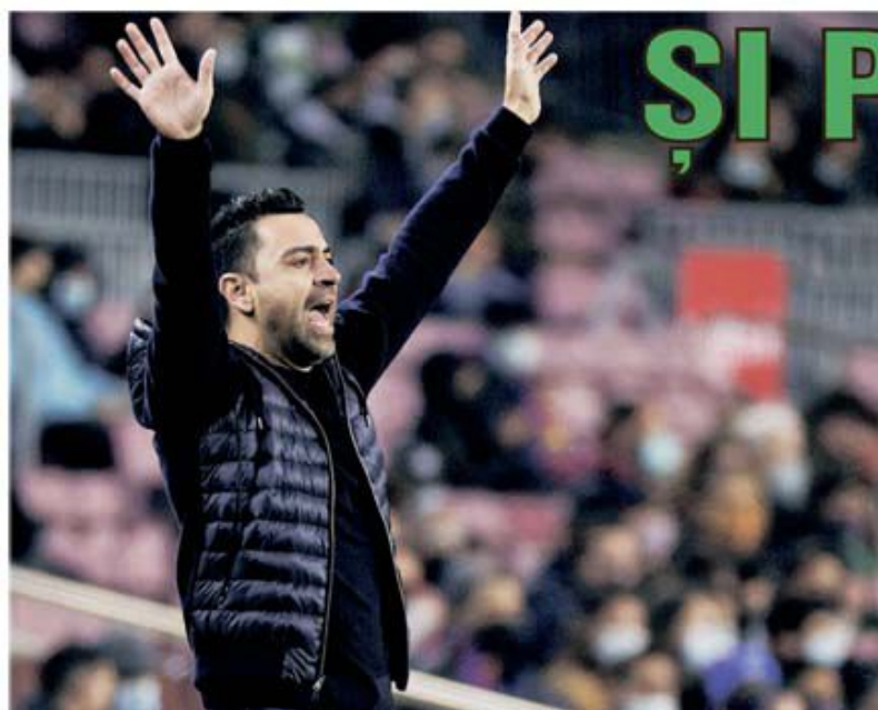
Xavi Hernandez a reușit primul lui succes în El Clasico în calitate de antrenor al Barcelonei, după numeroasele avute ca jucător. În filozofia sa de joc se regăsește clar stilul de joc avut de catalani pe vremea lui Pep Guardiola, când Xavi era jucător.