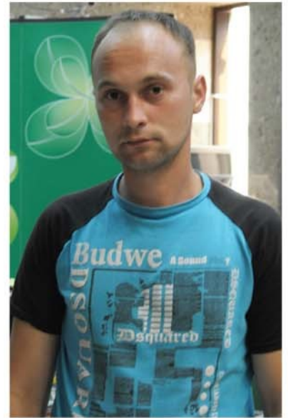
Text și imagini: Maria ELEFTERESCU

Ioan recunoaște că toate cadourile primite au fost frumoase, dar niciunul nu a avut impactul câștigului obținut la Loto 6 din 49. Deocamdată a început promițător. Acum este firesc să spere și la mai mult!