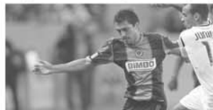
Farfan a adus victoria lui Philadelphia în '95