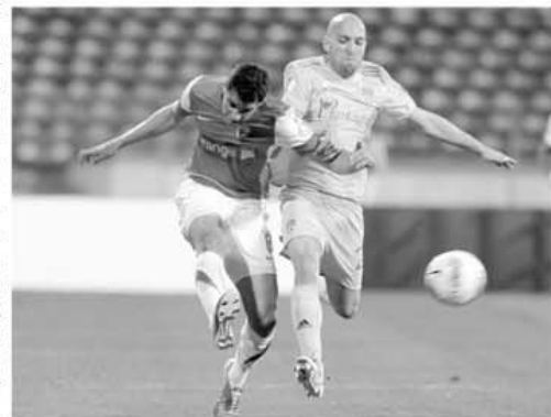
Apărâţi din iarbă verde, vasluienii lui Porumboiu au făcut din Groapă... groapă

pentru care, nu numai pentru el, pentru toată suflarea reajunsă în Ghencea, meciul de aseară cu GMM-ul lui Pustai devenise capital. Iată de ce aşa zisul derby Rapid - Dinamo nu rămâne decât