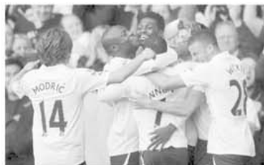
Bucurie în rândul jucătorilor lui Tottenham după victoria obținută, în fața lui Swansea, cu scorul de 3-1