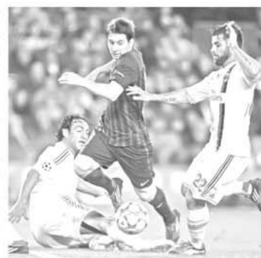
Messi a făcut din fundașii Milanului simple jaloane