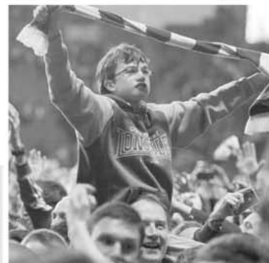
Publicul, cu mic, cu mare, salută revenirea echipei lor, Reading, în Premier League, după patru ani de absență