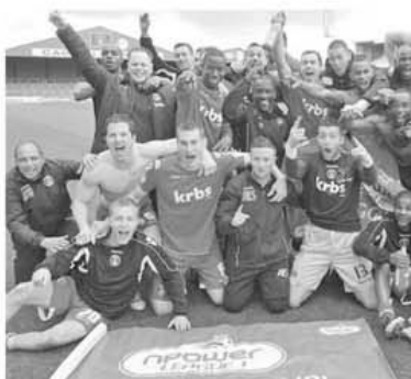
Bucurie generală printre echipierii lui Charlton Athletic. Echipa lor a promovat în Championship

Brentford - Sheff Wed; Bury - Oldham; Carlisle - Exeter; Colchester - Tranmere; Hartlepool - Leyton Orient; Preston - Charlton; Rochdale - Milton K. Dons; Scunthorpe - Bournemouth; Sheff Utd - Stevenage; Walsall - Huddersfield; Wycombe - Notts County; Yeovil - Chesterfield.