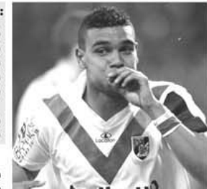
Internaționalul algerian El Arbi Hillel Soudani a înscris pentru Guimarães primul și ultimul gol al meciului cu Leiria, în 48' și 86'