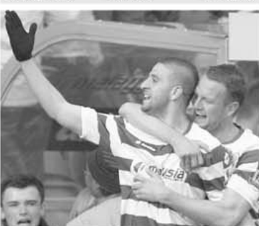
Adel Taarabt (stânga) a marcat, în minutul 24, golul victoriei lui QPR în meciul cu Tottenham (1-0)