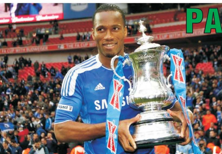
Didier Drogba, în brațe cu un trofeu neprețuit, Cupa Angliei. În finala de la Londra, Chelsea s-a impus cu 2-1, un gol marcat chiar de cel din imagine. Azi, marți, 8 mai, un nou meci Liverpool - Chelsea, de astă dată în campionat!, cu echipa londoneză pregătind o altă finală, cea de la 19 mai, cu Bayern Munchen, finala Champions League, pe pământ bavarez, Fußball Arena din Munchen. Lui Drogba i-a priit, până una-alta, Wembley-ul!

• Primul concurs al lunii mai nu a produs "bombe", și nici surprize reale, astfel că am consemnat apariția unei variante câștigătoare cu 13 rezultate exacte, "recompensată" cu aproape 9.000 de lei, jucat "la sferă". Echipele spaniole au evoluat conform calculului hârtiei, chiar și egalul smuls de Getafe la Bilbao încadrându-se în sfera normalității - Athletic se pregătește de finala bucureșteană a Ligii Europa, și poate doar semnele apărute în Serie A să fi pus probleme pronosportistilor.