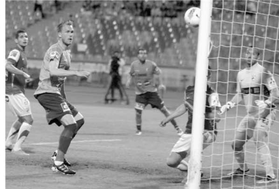
Golul lui Kapetanos i-a îngropat nu numai pe câini

recuperează, dacă se joacă pe bune!, așa cum contează pentru stilații și pretențioșii suporterii ai lui Dinamo să susțină echipa, poate recuperează ceva la finala de Cupă cu Rapid! Cât e până la