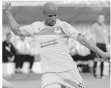
Wesley duce Vasluiul la bătaia peștelui... supereuropean

pentru titlu, dar la ce declarații dădea conducerea, mai va - deraiase, la Mediaș, pentru a recidiva pe Giulești, cu Pandurii. Mai venea după un egal al nimănui, așa că adio titlu. E bun și locul cinci, la o adică, loc după care plânge Răzvan în urmă cu patru etape. Loc de Europa League. Ceva aici, în Giulești, nu s-a legat, dincolo de șireturile