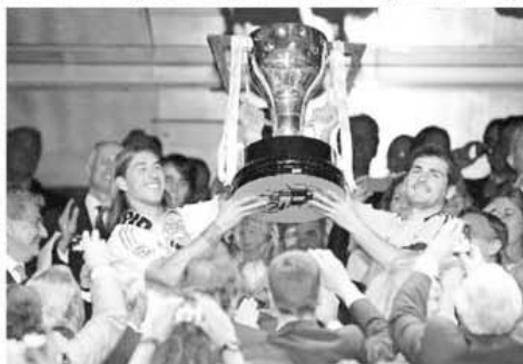
Trofeul acordat pentru câștigarea campionatului, purtat de șefii din teren ai "albilor", vice-căpitanul Sergio Ramos și căpitanul Casillas