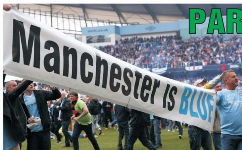
La Pariloto, pentru meciul Manchester City - QPR, din ultima etapă a Premier League, cotele erau 1.10 - 7.00 - 15.00. Cine s-ar fi îndoit de "realismul" lor? Cisse și Mackie, de la echipa oaspete! Căci, trecând peste golul lui Zabaleta, cu care Cetățenii conduceau din minutul 39, cei doi amintiți mai înainte stricau sărbătoarea "blue." Noroc cu golurile lui Dzeko și, respectiv, Aguero, ultimul în minutul 94, după care Manchester, ca în imagine, a devenit, cel puțin pentru un an, blue - după un scenariu a la Hitchcock!