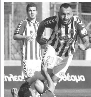
Tânărul internațional Mitroglu (23 ani) a egalat pentru Atromitos în 87' și a ajuns al doilea marcat în Superliga, cu 14 reușite