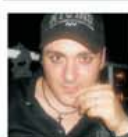
Correspondență din Castellammare di Stabia de la Clemente DE GAETANO (www.TuttoB.com)