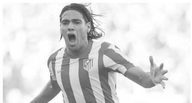
Radamel Falcao își duce echipa din nou într-o finală de Liga Europa

înaintea returului. "Rezultatul este corect. Acum evident suntem obligați să câștigăm acasă, dar acest lucru nu trebuie privit ca fiind ceva