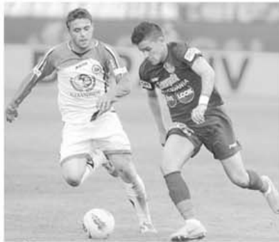
În Gruia a venit Concordia aducând cu ea discordia și un coș cu patru boabe pentru Beto

în joc și luate până la urmă de pe terenul de luptă de la Mioveni. Negru pe alb, sâmbătă în noapte, Rapid se insinuase pe 2 - loc de Champions League, în așteptarea meciului din Gruia și, voie de la Copos, a celui din Groapă. Și, în Gruia,