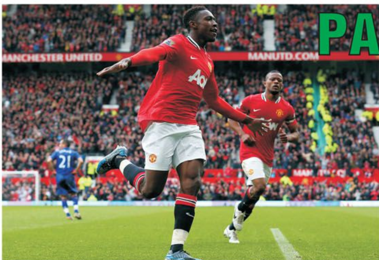
Cu patru etape înaintea finalului din Premier League, se credea că MU a scăpat în câștigătoare. Cu trei etape înainte... nu se mai știe. Manchester City a bătut în deplasarea de la Wolverhampton (firesc) iar, la Manchester United, Ferguson a scăpat caii pe miriște, 4-4 acasă, cu Everton (fază din meci), și distanța dintre cele două s-a micșorat la trei puncte. Urmează trei etape, ultimele, de foc.

• În privința meciurilor din primul eșelon, atât în Spania, cât și în Italia, nu s-au consemnat surprize. În schimb, toate cele patru partide din Serie B au furnizat rezultate greu de intuit, unele considerate chiar "bombe". Candidată la promovare directă, Verona s-a înclinat la modesta Crotona, Brescia la Ascoli, gazdele obținând a patra izbândă în ultimele cinci meciuri, Modena a câștigat de-abia a treia partidă în deplasare, la Empoli, iar Pescara, după patru etape fără succes, s-a impus la altă rivală la accederea în "A", Pescara.