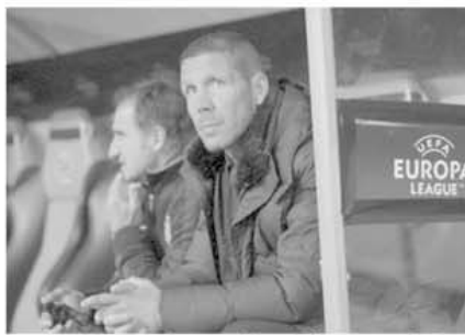
Diego Simeone a dus-o încă din primul sezon pe Atletico într-o finală de cupă europeană

un gol și două pase decisive. Bascii s-au impus prin golurile marcate de Markel Susaeta (17), Ibai Gómez (45+1), Llorente (88) și, respectiv, Ricky van Wolfswinkel (44). După 1-2 la Lisabona, Athletic a pus presiune din start asupra porții lui Sporting și în minutul 11 Andre Mar-