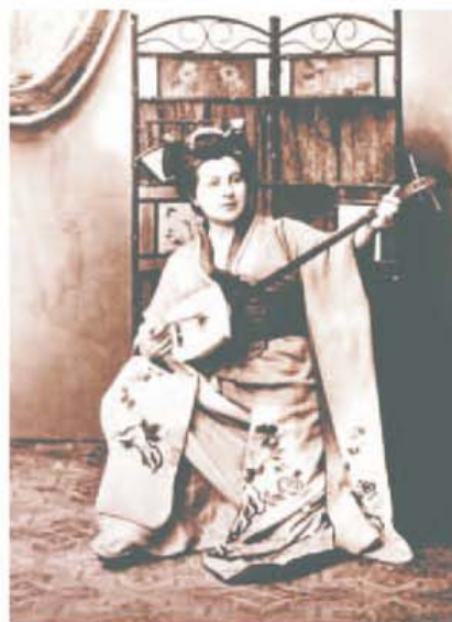
(1902), Opera Comică din Paris (1903). La București, în 1902 (cum și-a permis să fie înaintea Franței, țara în care se născuse scenariul?). De frumoasa soprană se îndrăgostise (uneori, nu numai de arta sa)