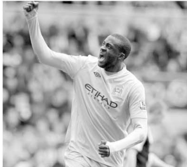
Manchester City a câștigat la Newcastle, cu 2-0, prin golurile realizate de Yaya Toure în minutele 70 și 89, această victorie netezind drumul echipei spre cucerirea titlului de campioană