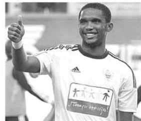
Samuel Eto'o, vedeta incontestabilă a lui Anzhi Makhachkala, autor a 13 goluri în primul sezon jucat în Rusia