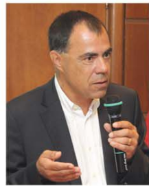
Pierre Cornu - UEFA, Șeful Consiliului de Integritate și Afaceri