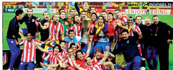
Atletico de Madrid, El Grande de Europa a București!