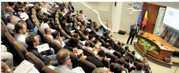
Loteria Română, locul de întâlnire al loteriilor europene. Și nu numai!