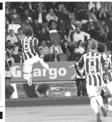
Emre Belözoğlu (nr. 5) a deschis scorul pentru Fenerbahçe după numai două minute