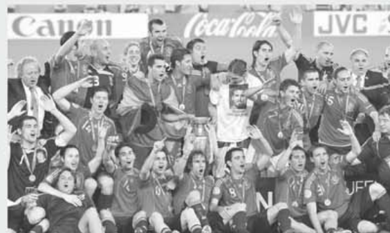
În 2008, Spania a cucerit pentru a doua oară în istorie titlul de campioană a Europei, după ce s-a impus cu 1-0 în fața Germaniei