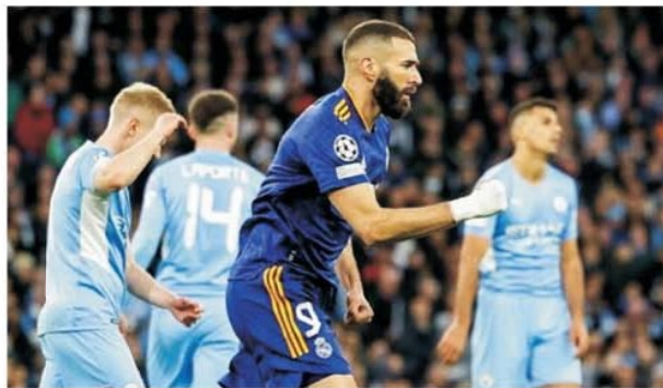
Meciuri ca Manchester City – Real Madrid trebuie înrămate și păstrate în colecția celor mai bune partide din istoria fotbalului

De departe partida de pe Etihad Park din Manchester a