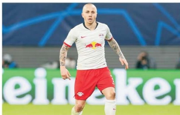
Spaniulul Angelino a marcat un gol de generic pentru nemții de la RB Leipzig

momentul în care vizitatorii au preluat din nou frâiele jocului, după golul semnat de Kamada (54). West Ham a avut multe oportunități, dar nu și-a fructificat ocaziile create. "Ciocănarii" au avut două bare, prin Benrahma (68) și Bowen (90+2). De