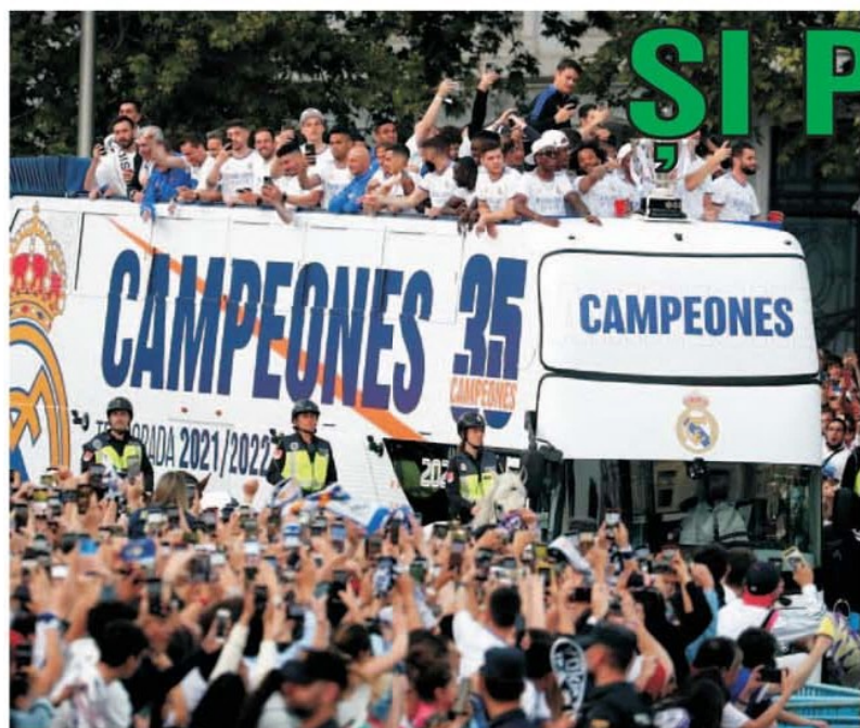
Real Madrid a cucerit al 35-lea titlu de campioană a Spaniei. Imediat după meci a urmat turul de onoare făcut de învingători în autocar deschis prin centrul capitalei Spaniei