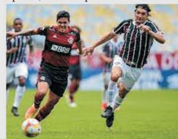
Derbiul Flu-Fla este unul din cele mai așteptate evenimente fotbalistice an de an în Brazilia

acum tribut faptului că participă și la Copa Libertadores, unde deja și-a câștigat grupa neînvinșă. Și pentru a obține calificarea în optimi, în campionat au evoluat