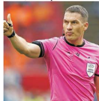
Istvan Kovacs va arbitra ultimul act al Conference League