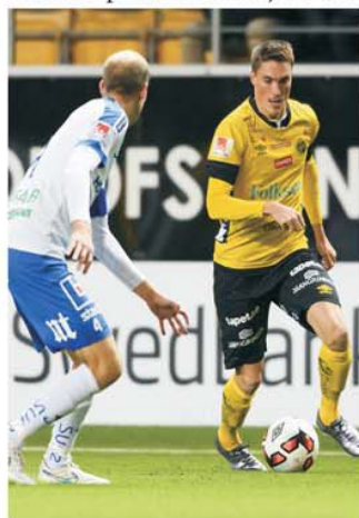
Meciurile dintre Norrköping și Elfsborg au fost mereu bogate în goluri

Partida Norrköping - Elfsborg se dispută în prima divizie a Suediei duminică, 29 mai. Este o confruntare între două dintre echipele care în fiecare sezon se numără printre formațiile care