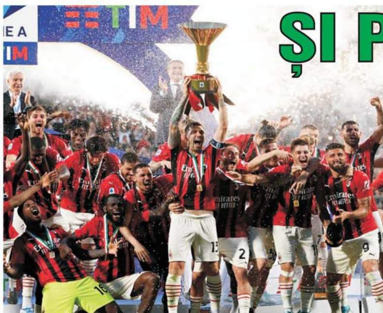
Fericire maximă în tabăra rossonero! Milan revine la comanda fotbalului italian după o pauză de 11 sezoane, fiind primul titlu după încheierea erei Berlusconi, de departe cea mai prolifică din istoria clubului.

Fondul de câștiguri la concursul Prono-S continuă să crească după ce la ultimul concurs a existat un singur câștig, în valoare de 6647 lei, cu unsprezece rezultate. Astfel că la următorul concurs, din 28-29 mai, sunt șanse reale ca fondul de premii să depășească suma de 40.000 de lei. Rezultatele care au făcut victime la ultimul Prono-S au fost succesul lui Bordeaux, deja retrogradată, la Brest, remiza lui Chelsea acasă cu Leicester și salba de egaluri din Ligue 1, cu meciuri având implicare la cupele europene. (S.D.)