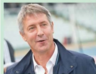
Cristiano Bergodi începe să își pună probleme după eșecul usturător cu Sandhausen

Sepsi Sfântu Gheorghe va juca în turul 2 preliminar al Conference League în compania echipei învingătoare din dubla turului 1, dintre Olimpija Ljubljana și Differdange din Luxemburg. Însă pentru covășneni, care au câștigat în premieră Cupa