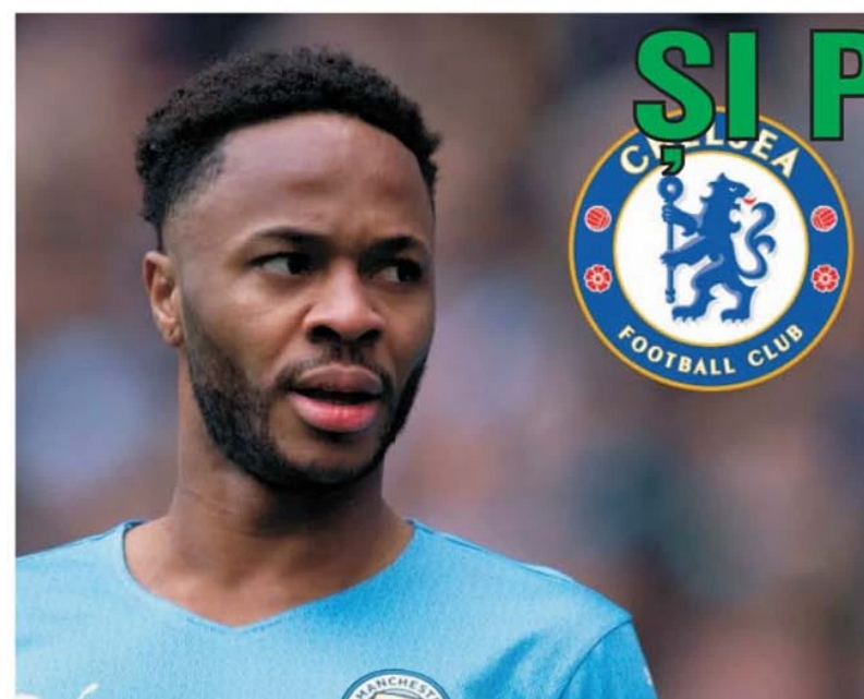
Lovitură de proporții de mercato în Premier League. Chelsea l-a transferat pe internaționalul englez Raheem Sterling de la Manchester City pentru 53 de milioane de euro, contract pe cinci ani.

• La concursul Prono-S din data de 9-11 iulie nu s-a consemnat nici un bilet câștigător la cele trei categorii. Astfel că pentru următorul concurs Prono-S cu meciuri din data de 14 iulie în totalitate, din returul partidelor din turul 1 preliminar al Conference League, fondul de câștiguri, în urma ultimului report, este de 63.769,68 lei, o sumă atractivă, care va poate determina să vă încercați inspirația, chiar dacă numele echipelor nu vă sună foarte familiar, fiind vorba de echipe din lumea mică a fotbalului european. (S.D.)