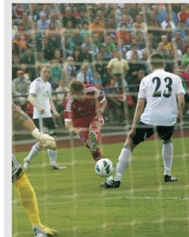
La Panevezys, în Lituania, moldovenii de la Milsami Orhei au obținut un 0-0 care le acordă acum prima șansă la calificare

km de capitala Chișinău, este un nume deja important în fotbalul din țara vecină, deși pe actul de naștere scrie 2005, adică în urmă cu 17 ani. Deja a cucerit titlul și cupe și are destule prezențe în Europa, unde în sezonul