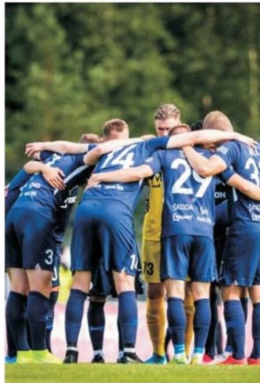
Bucuria fără margini a jucătorilor estonieni după prima lor victorie în cupele europene

poziție neașteptat de avantajoasă, pentru că Dinamo Tbilisi era văzută drept favorită certă la accederea în turul 2 preliminar. Și asta pentru că la capătul unui thriller în capitala Georgiei, devenit absolut neașteptat