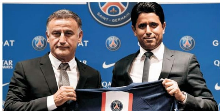
Tripleta Messi – Mbappe – Neymar, avertizată de noul antrenor al PSG că nu se vor mai tolera animozitățile din cadrul lotului

conturi, pentru a plăti celor de pe Coasta de Azur faptul că le-au luat antrenorul. Nu mai spunem că deja Galtier a devenit persona non grata în orașul său natal, care e tocmai Marseille, pentru că fanii lui OM au cei mai aprigi inamici la Paris și nu o dată a curs sânge la propriu. Dar Galtier pare a fi dintr-un alt aluat,