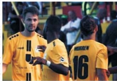
Luxemburghezii de la Dudelange au câștigat primul meci împotriva albanezilor din Tirana

În speranța că la Cluj CFR va pune lucrurile la punct în fața ambițioasei echipe din Eerevan și va face pasul în turul 2 preliminar al Champions League, am lăsat un ochi atent și la ce se petrece în confruntarea Dudelange - Tirana, de unde ar urma să vină rivalul din următoarea etapă.