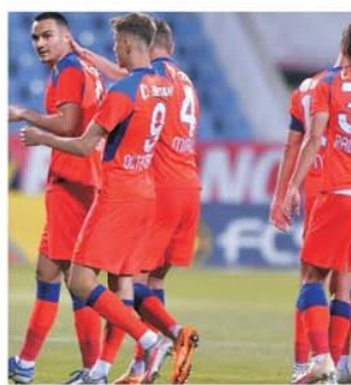
FCSB a jucat mai mult tenis în cele două meciuri de pregătire cu echipe din Moldova

FCSB nu a mai făcut nici un stagiul de pregătire în Turcia, Austria sau Cipru, cum se obișnuia an de an. Echipa patronată de latifundiarul Gigi Becali a mers la frații de peste Prut, în Moldova, unde au o mare popularitate și au jucat un amical, în compania Zimbrului Chișinău, după ce mai susținuse, cu câteva zile mai înainte un alt meci, tot în compania unei echipe din Moldova, FC Sfântul Gheorghe, dar în baza FCSB de la Berceni. Deși amicale și cu simpatii mari pentru bucureșteni, aceștia nu au fost la fel de simpatici cu tabela de marcaj, pe care au modificat-o de șase ori la fiecare meci. FC Sfântul Gheorghe, care