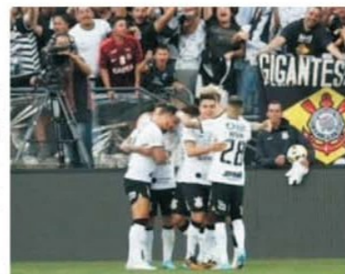
Bucuria jucătorilor de la Corinthians, după golul victoriei înscris

suișuri și coborășuri extrem de ciudate. Penultima clasată, Juventude, a ratat o mare șansă de a obține trei puncte de aur pe terenul altei echipe intrate de mai multă vreme în degringoladă, Coritiba. Alb-negrii au condus cu 2-0 la pauză și au mai ratat două imense ocazii în a doua parte, dar Coritiba a revenit altă echipă de la cabine și a reușit să obțină un punct. Un rezultat excelent și puțin scontat a reușit Cuiaba, chiar dacă pe