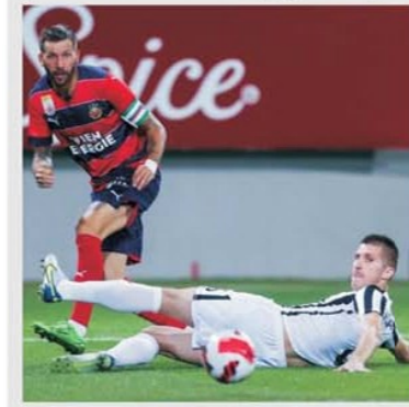
Rapid Viena a avut mare noroc marcând un gol la Baku, unde a pierdut cu 2-1 primul meci cu Neftci, pentru că are acum prima șansă la retur

Rapid Viena va juca pe teren propriu în compania echipei azere Neftci Baku, pe a cărei bancă tehnică se află din această vară românul Laurențiu Reghecampf. După despărțirea cu scandal de Universitatea Craiova, care i-a reproșat o atitudine deloc profesionistă în viața privată, cu