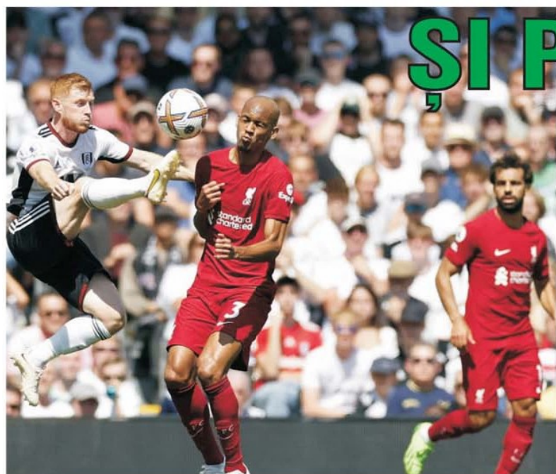
Nou promovata Fulham era considerată victimă sigură în fața lui Liverpool. Până la urmă cormoranii au fost cei care au alergat după golul de 2-2!

• Concursul Prono-S din 6-7 august, construit cu meciuri din prima etapă din Franța și Anglia, s-a omologat cu două variante câștigătoare, a câte 1.840 de lei fiecare, iar reportul însumat al primelor două categorii a depășit 45.000 de lei!, atractivă sumă de pornire pentru următorul concurs. "2" la Rennes - Lorient și la Manchester United - Brighton, "1" la Bournemouth - Aston Villa și "X" la Fulham - Liverpool au fost semnele care cu greu ar fi putut să fie anticipate de pronosporțiști (E.I.).