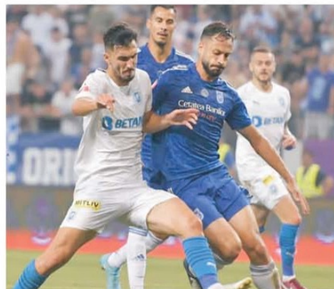
Derby-ul Craiovei s-a disputat la intensitate maximă atât pe teren, cât și în tribune

Mitanul secund i-a adus tot pe oaspeți în fața porții. Baiaram putea înscrie în minutul 50, dar Popa a reușit să intervină la timp și să