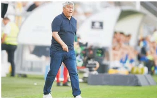
La 77 de ani Mircea Lucescu mănâncă în continuare fotbalul pe pâine și e la un pas de play-off-ul Champions League cu Dinamo Kiev

S-au jucat meciurile din prima mașă a turului 3 preliminar din Champions League. Putem spune fără nici o teamă de a greși că Benfica Lisabona, Bodo Glimt, Maccabi Haifa și Steaua Roșie Belgrad sunt deja în play-off și, prin urmare, sunt sigure de prezența în grupele Europa League dacă vor fi învinse. Ele au obținut victorii la mare diferență de scor. Un pas uriaș au făcut și Viktoria Plzen, victorie la Tiraspol, și Dinamo Zagreb, succes în Bulgaria, cu Ludogoreț. Se joacă totul la retur în Sturm Graz