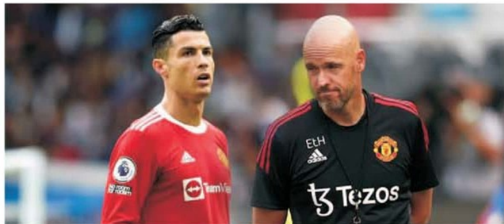
Cristiano Ronaldo e în război deschis cu antrenorul lui Manchester United, olandezul Erik ten Hag

de fluierul final. Ronaldo se crede dacă nu zeu, cu siguranță un semizeu intangibil de deciziile unor antrenori muritori de rând. Se