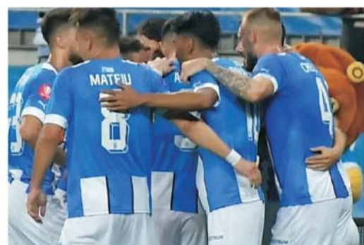
Explozie de bucurie colectivă a jucătorilor craioveni după calificarea în play-off