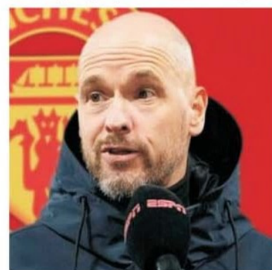
Olandezul Erik ten Hag încearcă să readucă gloria de altădată la Manchester United

Cupe ale Campionilor (sau Ligi) față de cele trei ale lui Manchester. La nivel de trofee, un avantaj minor îl are Manchester United cu 66 de trofee în fața celor 63 realizate până acum de Liverpool.