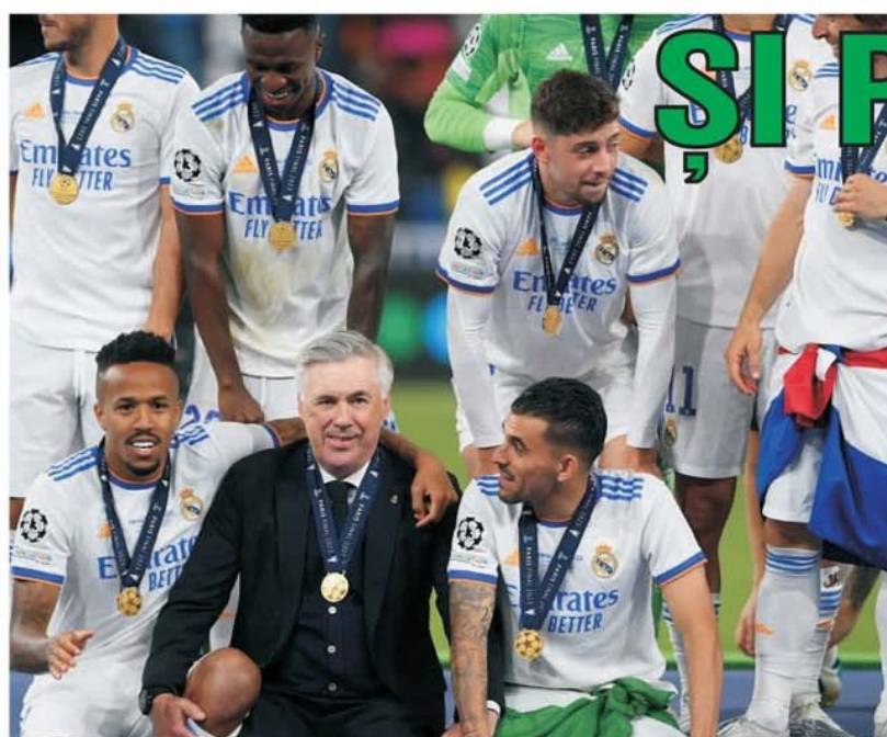
Real Madrid a cucerit Supercupa Europei după un lejer 2-0 cu Eintracht Frankfurt și a egalat recordul de cinci trofee deținut până acum de Barcelona și Milan. Carlo Ancelotti a devenit antrenorul cu cele mai multe Supercupe ale Europei, patru la număr.