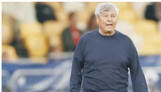
Mircea Lucescu e același antrenor fenomenal și la 77 de ani. Dinamo Kiev s-a calificat în play-off-ul Champions League

S-au încheiat partidele din cadrul turului 3 preliminar al Champions League. Remarcabil ceea ce continuă să facă veteranul antrenorilor europeni, Mircea Lucescu, la Dinamo Kiev. După Fenerbahce și austrieicii de la Sturm Graz s-au predat în fața foarte disciplinate echipe a românului. Dinamo a fost egalată în cele 90 de minute la scorul general, dar în prelungiri a marcat de două ori și acum e gata de o nouă confruntare cu Benfica, pe care a avut-o colegă în grupele Champions League sezonul trecut! Echipa lui