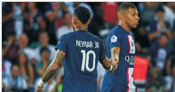
Relația Mbappe - Neymar e una tot mai șubredă, amenințând unitatea din vestiarul PSG

extrem de vizibil gesturi de solicitare a balonului, pentru a executa tot el, Neymar nici nu l-a privit, a luat mingea, a bătut și a marcat. Dihonia era gata să intre în cei doi, mai ales că Mbappe nu și-a ascuns nici la început de sezon