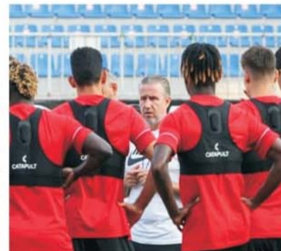
Cu Neftci Baku, Reghecampf nu a reușit să dispute decât două tururi în Conference League, înregistrând două victorii și două înfrângeri