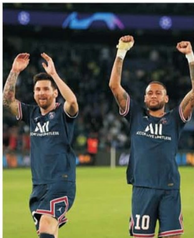
Trioul Neymar-Mbappe-Messi e la nivel maxim sub comanda lui Christophe Galtier

Lille – PSG este clar capul de afiș al etapei a 3-a din noul sezon de Ligue 1. Un meci extrem de așteptat dintr-un motiv special. Pe banca parizienilor se află din această vară antrenorul Christophe Galtier. Adică nimeni altul decât eroul lui Lille din 2021, când echipa din