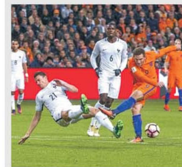
Țările de Jos au fost prea... Sus pentru belgieni în primul meci direct, pierdut de belgieni acasă cu 4-1

Un meci între vecinele Țările de Jos și Belgia este permanent o confruntare la curent de înaltă tensiune. Asta pentru că există o foarte veche rivalitate, care face atunci când cele două naționale,