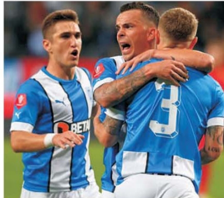
Jucătorii Craiovei se felicita la finalul partidei câștigate contra FCSB-ului

reprise, FCSB a primit un penalty, după un fault asupra lui Compagno, care a și