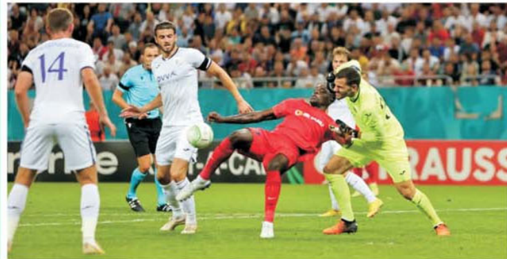
FCSB a avut un penalty clar ca lumina nocturnei la Dawa, dar arbitrul a orbit brusc

În mod inexplicabil, Conference League este singura competiție europeană intercluburi unde VAR-ul a fost considerat un element care nu este necesar arbitrilor și nu întâmplător în cele două etape de Europa desfășurate până acum marile probleme de arbitraj au apărut aproape în totalitate în Conference League. Au existat, e adevărat, și în Champions, ba încă la un supermeci de talia Bayern - Barcelona, dar Conference League a strâns grosul