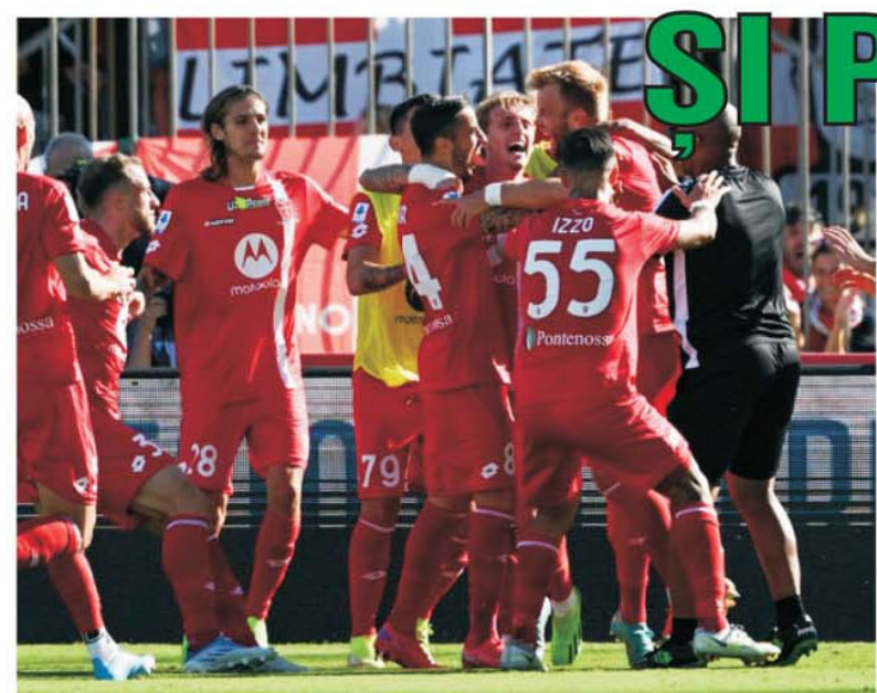
Debutantă în istoria Serie A, Monza, echipa patronată de fostul premier al Italiei, Silvio Berlusconi, a obținut primul ei succes la acest nivel tocmai în meciul cu Juventus, pe care a învins-o pe teren propriu cu scorul de 1-0.

• Concursul Prono-S din 17-18 septembrie a fost unul fără egal. Nu s-a înregistrat niciun rezultat de egalitate și nu a apărut niciun câștig în urma omologării. În acest fel, următorul concurs a avut la start peste 15.700 de lei, acesta fiind reportul cumulat al tuturor celor trei categorii. Semne greu de ghicit s-au consemnat la partidele Torino - Sassuolo, Salernitana - Lecce, Valladolid - Cadiz, la toate fiind "2", iar "1" la Udinese - Inter poate fi considerat chiar "bomba" etapei. (E.I.)