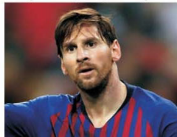
Lionel Messi a plecat de la Barcelona la PSG după ce megacondițiile sale impuse catalanilor pentru a continua au fost refuzate

Când a decis să plece în vara anului 2021 de pe Nou Camp, acolo unde fanii Barcelonei credeau că idolul lor va dori să și fie înmormântat în semn de cât de mult a iubit culorile blaugrana, argentinianul Lionel Messi a fost pe cale să declanșeze o revoluție în Catalonia, mai ceva decât mișcarea de independență față de Spania.