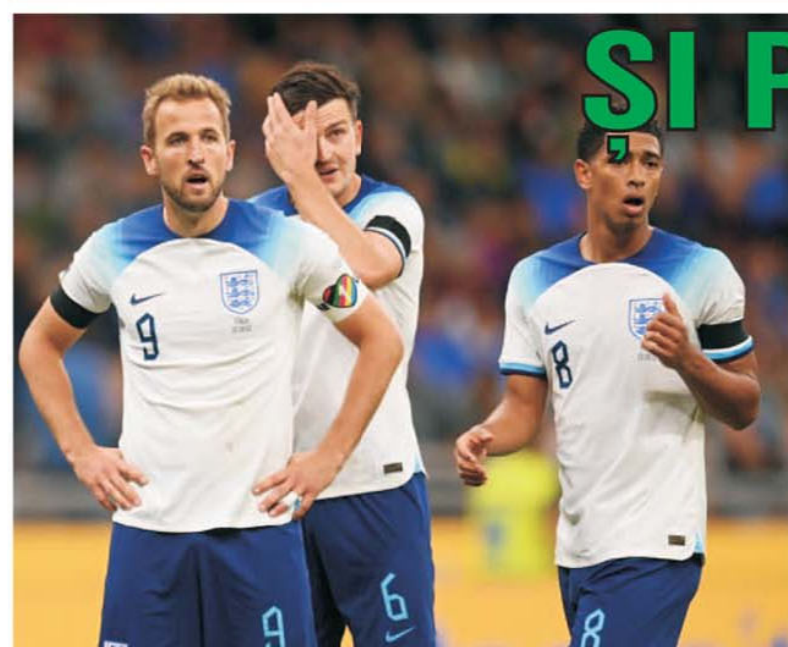
Dezastru pentru fotbalul din cel mai tare campionat din lume, Premier League. Eșecul cu 1-0 din Italia a însemnat retrogradarea Angliei în divizia B a Nations League!