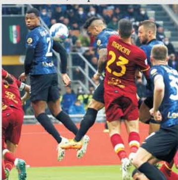
Ultimul meci dintre Inter și Roma s-a disputat pe 23 aprilie și s-a încheiat cu succesul echipei gazdă, 3-1

Abia s-au scurs șapte etape din această ediție de campionat și avem parte de un derby de tradiție din “calcio”: Inter – Roma. Cele două formații se vor “duela” pe Stadio Giuseppe Meazza sâmbătă seara, de la ora 19.00, după ce în runda de