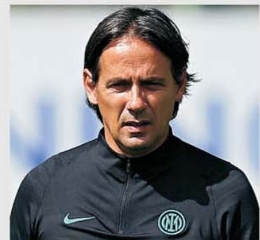
Urmează două adevărate teste pentru Simone Inzaghi: Roma și Barcelona

Simone Inzaghi dispune de un lot valoros, cu Handanovic, de Vrij, Skriniar, Calhanoglu, Barella, Brozovic, Dzeko, Lautaro Martinez, alături de nou-veniții Mkhitaryan (Roma), Lukaku (Chelsea), Acerbi (Lazio).