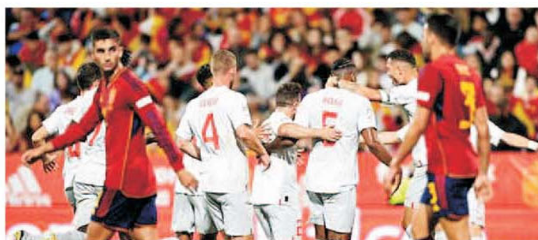
Elvețienii se felicită în timp ce spaniolii sunt dezorientați în urma neașteptatei înfrângeri de la Zaragoza, 1-2