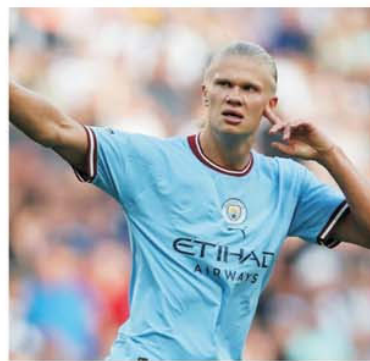
Norvegianul Erling Haaland s-a integrat foarte bine în angrenajul lui Pep Guardiola

“Manchester derby”, cum este denumit de mass-media britanică, se joacă pentru a 188-a oară! Prima întâlnire dintre “cetățeni” și “diavoli” s-a consemnat pe 12