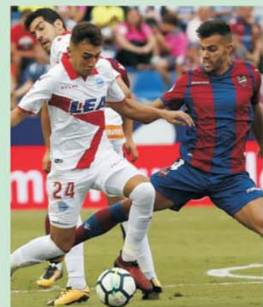
Alaves - Levante este derbyul etapei a 20-a din La Liga 2, penultima etapă a turului acestui sezon

egaluri. Practic este un meci de La Liga care momentan se joacă în eșalonul secund al fotbalului spaniol. Și, de obicei, când ies