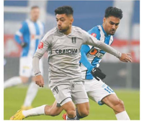
Jucătorii lui FCU au fost mereu cu un pas înaintea rivalilor din oraș

Mirel Rădoi a fost extrem de supărat după