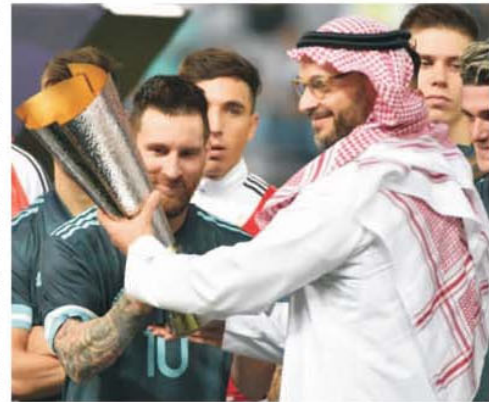
Lionel Messi primind trofeul de la Mohammad bin Salman după amicalul Brazilia - Argentina organizat în Arabia Saudită acum doi ani

fost surprize indiscutabile, cazul australienilor sau al marocanilor, dar în urma celorlalte rezultate zac grămadă germeii unor mari îndoeli că nu am asistat la piese de teatru. Pe una o știm clar, calificarea Japoniei cu larga complicitate iberică, dar aceștia spun că și-au văzut interesul de a