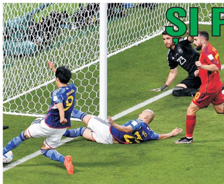
Cel mai controversat moment al Mondialului. Tehnologia a spus că a fost gol pentru Japonia în victoria cu Spania, pentru doi milimetri mingea neieșind complet afară, și așa a plecat Germania acasă

• Concursul Prono-S din 10-11 decembrie a început cu un atractiv report cumulat al primelor două categorii de peste 18.700 de lei și cuprinde partide din eșaloanele secunde ale Italiei și Spaniei, Serie B și Segunda Division. Printre cele mai interesante întâlniri sunt cele dintre Frosinone și Pisa, la echipa oaspete evoluând trei fotbaliști români, Venezia și Cosenza, un duel în zona inferioară a ierarhiei, precum și meciul dintre Zaragoza și Huesca, derby al regiunii Aragon. (E.I.)