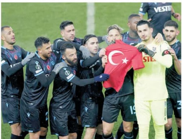
La Trabzonspor a fost mai întâi un uriaș omagiu pentru victimele seismelor din Turcia îmbrăcat într-un meci de fotbal

Polonezii de la Lech Poznan pleaseră înfrigurați și la propriu și la figurat în Norvegia, la gândul că vor juca aproape de Cercul Polar, cu echipa care a făcut set de tenis, 6-1, cu AS Roma. Dar Bodo Glimt de acum nu mai este nici pe departe Bodo Glimt de atunci și acest lucru chiar s-a văzut din plin. Bodo Glimt a vândut tot ce avea mai bun, dar ceea ce a adus în schimb e departe de valoarea jucătorilor plecați. A contat sigur și faptul că în Norvegia nu e deloc sezon,