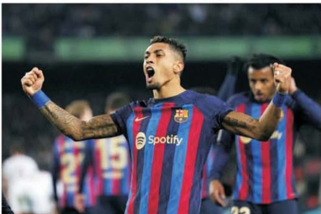
Cu un gol și o pasă de gol, Raphinha a contribuit decisiv la remiza Barcelonei

Union Berlin, Manchester United, Midtjylland, Nantes și Monaco.