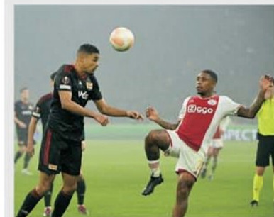
În tur a fost 0-0 la Amsterdam, dar echipa mai aproape de victorie a fost cea germană

Partida Union Berlin – Ajax Amsterdam are loc joi, 23 februarie, de la ora 22:00, pe stadionul An der Alten Försterei, în manșa retur a play-off-ului de calificare în optimile de finală ale Europa League. Pentru echipa germană basmul poate continua la acest meci retur, după ce la Amsterdam, pe arena care poartă numele legendarului Johan Cruyff,