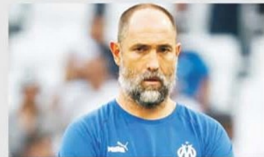
Igor Tudor vrea să aducă bucurie publicului fierbinte din Marseille: primă victorie acasă, în campionat, după 11 ani, 3-0 pe 28 noiembrie 2011

campionat, PSG a făcut-o doar în deplasare, 1-3 cu Lens, 0-1 cu Rennes și 1-3 cu Monaco. Așa că un insucces pe Stade Velodrome s-ar încadra la astfel de comportament. Să mai remarcăm că trupa lui Christophe Galtier dă semne de slăbiciune în ultima vreme, alimentate probabil și de un vestiar aflat în prag de dezintegrare. După trei eșecuri la rând, în Cupă, în campionat și în Champions League, a reușit duminică o "remontada" spectaculoasă cu Lille. Avea 2-0 în minutul 17, s-a văzut condusă cu 2-3 peste 52 de minute, pentru ca finalul să îi aparțină grație l