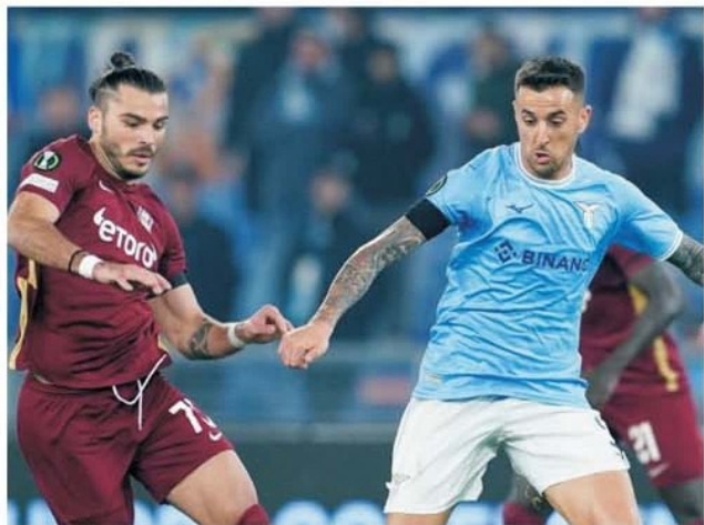
CFR a luptat în meciul cu Lazio, dar absența unui jucător care să știe cu mingea și să dea pase decisive atacanților s-a văzut din plin

CFR Cluj a pierdut primul meci din dubla cu Lazio din play-off-ul Conference League. Un eșec scurt, 1-0 pentru romani, cu un supergol al recordmanului all time de eficacitate al lazialilor, Ciro Immobile, venit exact când doare cel mai tare, pe ultima acțiune