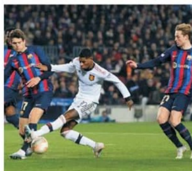
Marcus Rashford, la balon, a făcut un meci mare pe Nou Camp, iar acum vrea să repete performanța

Cel mai așteptat meci din cadrul play-off-ului Ligii Europa este fără doar și poate întâlnirea retur de pe Old Trafford dintre Manchester United și