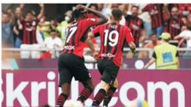
Partidele AC Milan – Atalanta s-au jucat mereu la victorie și de o parte, și de alta

AC Milan – Atalanta este meciul vedetă al etapei 24 din Serie A care are loc duminică, 26 februarie, de la ora 21:45, pe stadionul San Siro din Milano. Avem de-a face, după celebrul război al orașului Milano, Il derby della Madonnina, cu un derby al regiunii