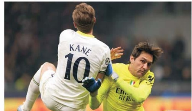
Ciprian Tătărușanu l-a pus la respect pe Harry Kane în AC Milan - Tottenham