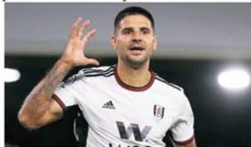
Sârbul Aleksandar Mitrovic este principala gură de foc a lui Fulham

Mikel Arteta este aproape de a readuce titlul pe Emirates Stadium după o pauză de 19 ani, însă, până să-și atingă obiectivul, trebuie să mai treacă peste câteva hopuri. Unul dintre