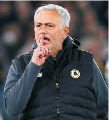
Jose Mourinho vrea să câștige cu AS Roma al treilea trofeu Europa League din carieră

au câte două echipe. În optimi au mai ajuns formații din Belgia, Turcia, Ucraina, Olanda, Ungaria și Portugalia. Este poate cea mai puternică ediție din istoria competiției, cu câțiva granzi „flămânzi” după cel de-al doilea trofeu continental.