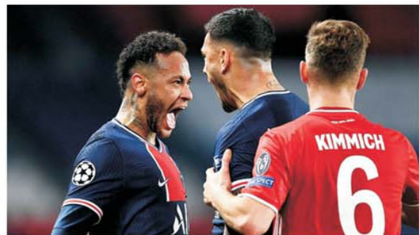
Bayern Munchen - PSG este marele șoc al returului optimilor de finală din Champions League

tar i-au pus antrenorului Christophe Galtier sabia la gât. Rămâne pe banca lui PSG numai dacă întoarce soarta calificării. Cum acest lucru este foarte greu de promis, deja Zinedine Zidane pare a fi în joc de glezne, prima sa condiție pentru a veni la PSG fiind îndepărtarea mărului stricat din lot, brazilianul Neymar, care distruge atmosfera cu viața lui mult prea tumultuoasă. Desigur, PSG are șansele ei de a se impune la Munchen, pentru că atunci când ai pe Leo Messi și pe Kylian Mbappe în atac și pe ferosul Sergio Ramos în apărare poți spera justificat să remediezi situația. La Londra vor fi două meciuri la sânge, ambele echipe engleze putând fie merge în rai sau în iad la fel de ușor, pentru că au