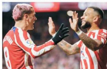
Griezmann și Depay, principalii artizani ai victoriei lui Atletico Madrid