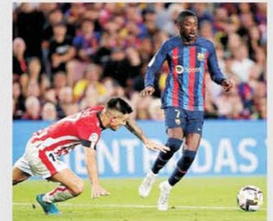
În partida din tur, Athletic a fost la pământ pe Camp Nou: 0-4, pe 23 octombrie

La Barcelona se instalase un optimism solid în urma unui traseu cu 18 partide oficiale fără înfrângere, precedentă datând din 26 octombrie (!), 0-3 cu Bayern, acasă, în Champions League.