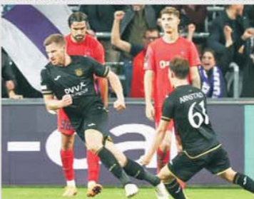
Anderlecht nu a fost în stare să bată rezervele FCSB în două meciuri, dar visează să doboare Submarinul galben Villarreal

Anderlecht – Villarreal este cel mai atractiv meci din faza optimilor de finală din Conference League. Anderlecht se află de câțiva ani într-o fază de tranziție care însă pare că nu se mai termină, din nobilul cu haine cu fireturi de aur al fotbalului belgian rămânând doar amintirile perioadei în care alb-violetii aduceau în vitrina clubului trofee europene. Anderlecht are cinci succese