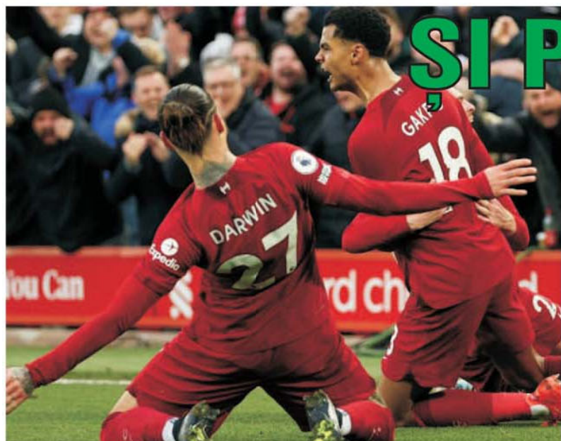
De peste 91 de ani FC Liverpool nu mai pierduse cu scorul de 7-0 în Premier League. Se întâmpla în 1931 la un meci cu Wolverhampton Wanderers. Dezastrul de pe Anfield Road, 7-0 pentru cormorani în fața diavolilor roșii, e ciudat pentru că United era neînvingă de 25 de meciuri!