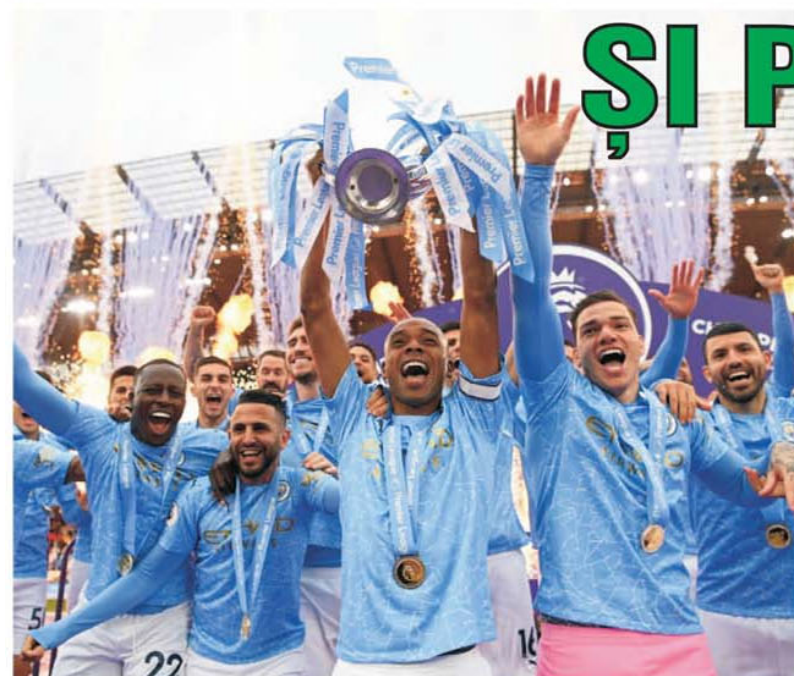
Regina fotbalului englez este în continuare Manchester City, echipa lui Pep Guardiola terminând pentru a cincea oară în ultimii șase ani campioană în Premier League

● La concursul Prono-S din 20-21 mai s-au înregistrat patru câștiguri de categoria a III-a, fiecare a câte 990 de lei, iar reportul cumulat al primelor două categorii însumează aproape 6.000 de lei. Dintre cele 13 semne, trei "2"-uri se încadrează la rubrica "surprize", câte unul în Spania, Franța și Anglia, la partidele Rayo Vallecano - Espanyol, Nantes - Montpellier și Tottenham - Brentford. (E.I.)