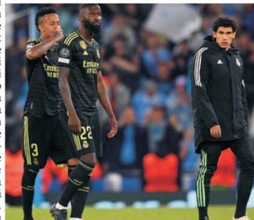
Cu acest 4-0 încasat la Manchester din partea lui City o mare parte dintre jucătorii cu vechime ai lui Real Madrid nu vor mai fi galactici din vară

petrodolari investiți de patronii șeici din Emiratele Arabe Unite. City a reușit să aducă pe bancă pe unul dintre cei mai buni antrenori ai anilor 2000, Pep Guardiola. Echipa din Manchester s-a transformat în stăpânul de necontestat din Premier League, unde este la câteva minute pentru a se încorona pentru a cincea oară în ultimii șase ani. Cu toate acestea