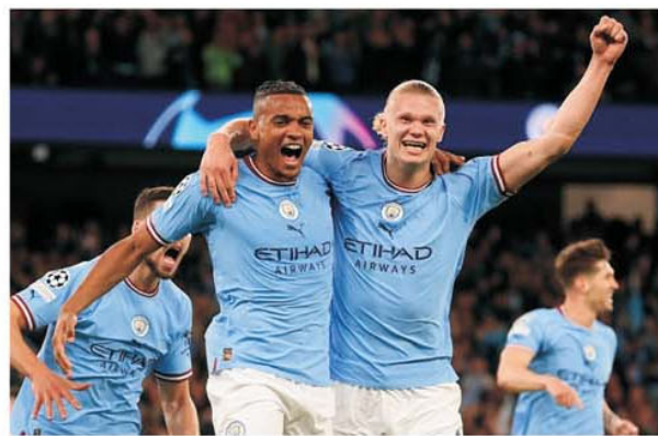
Manchester City a pus Realul la respect și va juca finala Champions League cu Inter

Balonul de Aur, Karim Benzema, a fost o adevărată fantomă, pentru că nimeni nu l-a văzut să îl deranjeze în vreun fel pe portarul Ederson, un adevărat șomer în acest meci. Tot patru goluri primise Real Madrid și sezonul trecut în semifinale de la Manchester City acasă la englezi, dar atunci ibericii au răspuns cu trei contre în cel mai frumos și mai dramatic meci dintre ele, victoria cu 4-3 nefiind suficientă ca Pep Guardiola să ajungă la a patra finală de Champions League, după cele două succese cu FC Barcelona și finala ratată la loviturile de departajare cu Chelsea. Anul trecut Real Madrid pusese a 14-a stea la cele deja existente la rubrica Champions League, dar acum acest eșec atât de sever ar putea fi începutul unei adevărate