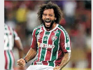
Marcelo este cel mai cunoscut fotbalist de la Fluminense

la 1 mai după ce nu mai antrenase din decembrie 2021. Campion al Braziliei la cărma echipelor Palmeiras, Santos, Corinthians și Cruzeiro, el va sta pe bancă până la finalul ediției. În lot, printre veterani îi are la dispoziție pe portarul Cassio (35, căpitan), fundașul central Gil (35), fundașul