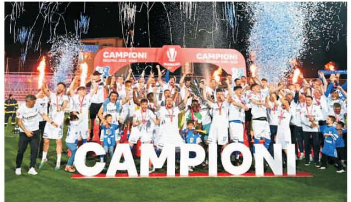
Farul Constanța este noua campioană a României după ce a câștigat derby-ul cu FCSB

La Ovidiu s-a jucat "finala" campionatului. Dacă Farul o învingea pe FCSB era campioana ediției 2022-23 a Superligii. La oricare alt rezultat, titlul se decidea în ultima rundă, când Farul avea meci la Cluj, cu CFR, și FCSB primea vizita Rapidului pe Arena Națională. A rezultat un meci de care pe care cu o răsturnare incredibilă de situație și cu "marinarii" în premieră campioni ai României.