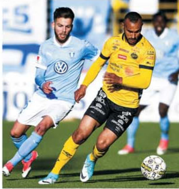
Se așteaptă un meci deschis la Boras între două echipe de pe podium, Elfsborg – Malmo FF

CV-ul celor două echipe nu suportă comparație, Malmo având în palmares și o finală de Liga