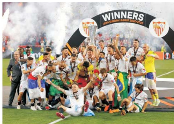
FC Sevilla a reușit o performanță greu de imaginat și de egalat, să câștige toate cele șapte finale de Europa League jucate

a competiției, a avut multe momente de reală dificultate. AS Roma a fost cea care a deblocat în prima repriză tabela de marcaj în minutul 35, iar echipa lui Mendilibar a egalat în minutul 55, cu destul noroc pentru că bietul Mancini a fost cel care a lovit involuntar balonul care l-a păcălit pe portarul Rui Patricio. Din păcate pentru fair-play-ul partidei și pentru stabilirea echipei câștigătoare, după ce a primit o bilă albă la reluarea VAR neacordând un penalty ibericilor în mod corect, mingea fiind jucată evident de fundașii Romei, avea să iasă la rampă în mod negativ arbitrul englez Anthony Taylor. În minutul 82 el nici măcar nu a vrut să ceară VAR la un henț clar comis de un apărător de la Sevilla în propriul careu, reluările demonstrând clar că jucătorul avea mâna depărtată de corp, deci era penalty. Apoi același arbitru englez, al cărui nume