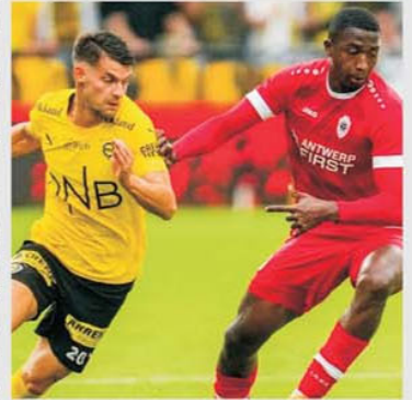
Duelurile Brann Bergen - Lillestrom au fost mereu pe muchie de cuțit

Grenland, și la Oslo, cu Valerenga, un egal cu Ham Kam și un eșec la Stavanger, cu Viking. Pentru a găsi ultima victorie reușită de Lillestrom la Bergen trebuie să venim înapoi până în 2016, când a fost 2-1 pentru galben-negri pe terenul alb-roșilor. În general