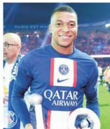
Kylian Mbappé (PSG) - 29 de goluri