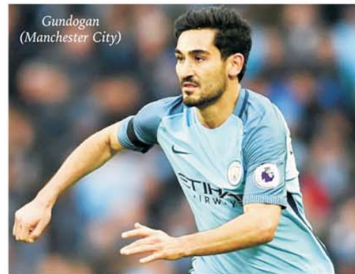
Gundogan (Manchester City)

Depunerea buletinelor de joc la concursul PRONO-S din 10-11 iunie 2023 se poate face începând de duminică, 4 iunie, după ora 16.00, și până joi, 8 iunie, ora 16.00. Pe buletinele de joc SE VA MARCA RUBRICA DA, MIERCURI