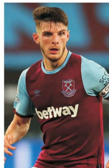
Căpitanul lui West Ham, Declan Rice, este cel mai scump jucător din lotul celor două formații calificate în finala Conference League

evoluat în grupă cu FCSB, reușind să-i învingă pe roș-albaștri în ambele meciuri. În semifinale, londonezii au trecut de AZ Alkmaar, grație victoriei din tur cu 2-1. Meciul retur s-a încheiat cu scorul de 0-0.