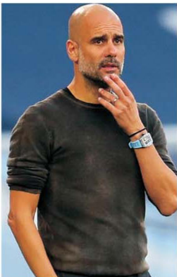
Pep Guardiola țintește al treilea trofeu al Ligii, după ce l-a câștigat pe precedentele cu Barcelona

În viziunea bookmakerilor, Pep Guardiola și compania sunt marii favoriți ai finalei, cu o cotă cuprinsă între 1.18 și 1.30, iar cota celor de la Inter variază de la 6.00 la 9.00. Kun Aguero este cel mai bun marcatore al lui City în UCL, cu 39 de reușite, iar Mahrez, cu 16 goluri, este golgeterul din actualul lot al englezilor. Fernandinho este jucătorul cu cele mai multe apariții în Ligă în tricoul grupării din Manchester, 75. Pentru Inter va fi a șasea finală din istorie. Milanezii au ridicat de trei ori trofeul, ultima dată în 2010, cu românul Cristi Chivu pe teren. Atunci, italienii s-au impus în fața lui Bayern Munchen, scor 2-0, grație