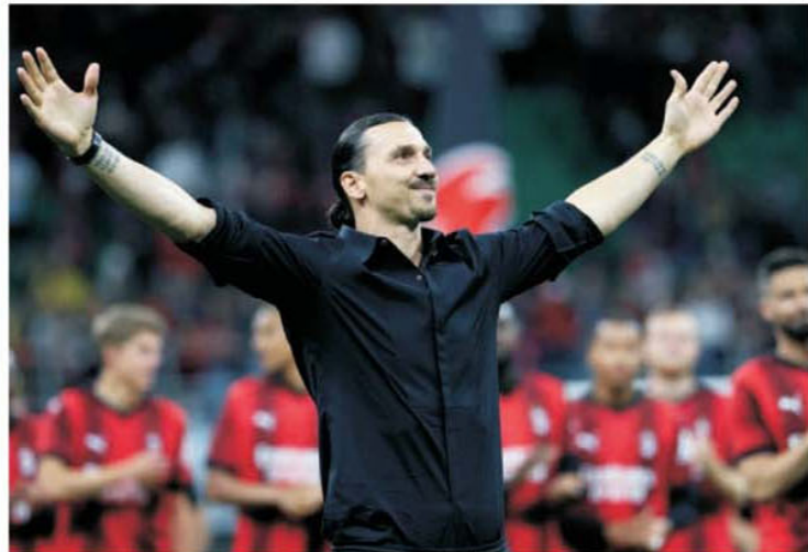
Zlatan Ibrahimovic a decis, la 41 de ani, să stingă reflectoarele în urma sa

Dacă despre fotbalistul Ibrahimovic vom vorbi de acum înainte doar la trecut, în privința altor nume mari din sportul rege vom vorbi ca despre niște păsări călătoare care și-au găsit cuiburi de lux în țările calde din Golf, mai precis în Arabia Saudită. Care, în dorința de a obține de la FIFA organizarea turneului final al CM 2030 alături de Egipt și Grecia, a pregătit un plan absolut nebun pentru a impresiona. A venit,