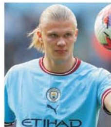
Erling Haaland (Man. City) - 36 de goluri

Arsenal - Wolves 5-0 (Xhaka 11', 14', 27'; Jesus 58'; Kiwior 78'); Aston Villa - Brighton 2-1 (Luiz 8'; Watkins 26' - Undav 38'); Brentford - Man. City 1-0 (Pinnock 85'); Chelsea - Newcastle 1-1 (Trippier 27', aut. - Gordon 9'); C. Palace - Nottingham 1-1 (Hughes 66' - Awoniyi 31'); Everton - Bournemouth 1-0 (Doucouré 57'); Leeds - Tottenham 1-4 (Harrison 67' - Kane 2', 69'; Porro 47'; Moura 90'+5); Leicester - West Ham 2-1 (Barnes 34'; Foes 62' - Fornals 79'); Man. Utd - Fulham 2-1 (Sancho 39'; Fernandes 55' - Tete 19'); Southampton - Liverpool 4-4 (Ward-Prowse 19'; Sulemana 28', 48'; Armstrong 64' - Jota 10', 73'; Firmino 14'; Gakpo 72').