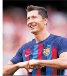
Lewandowski (Barcelona) - 23 de goluri