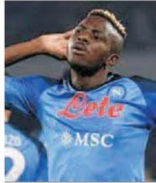
Osimhen (Napoli) - 26 de goluri

Sassuolo - Fiorentina 1-3 (Berardi 71', 11m - Cabral 46'; Saponara 79'; González 83'); Torino - Inter 0-1 (Brozovic 37'); Cremonese - Salernitana 2-0 (Buonaiuto 26', 11m; Tsadjout 88'); Empoli - Lazio 0-2 (Romagnoli 48'; Alberto 90'+2); Napoli - Sampdoria 2-0 (Osimhen 64' 11m; Simeone 85'); Atalanta - Monza 5-2 (Koopmeiners 12', 45'+1, 79'; Højlund 74'; Muriel 90'+2 - Colpani 51'; Petagna 81'); Roma - Spezia 2-1 (Zalewski 43'; Dybala 90'+1, 11m - Nikolaou 6'); Lecce - Bologna 2-3 (Banda 17'; Oudin 88' - Arnautovic 58'; Zirkzee 81'; Ferguson 90'+7); Milan - Verona 3-1 (O. Giroud 45'+2, 11m; Leão 85', 90'+2 - Faraoni 72'); Udinese - Juventus 0-1 (Chiesa 68').