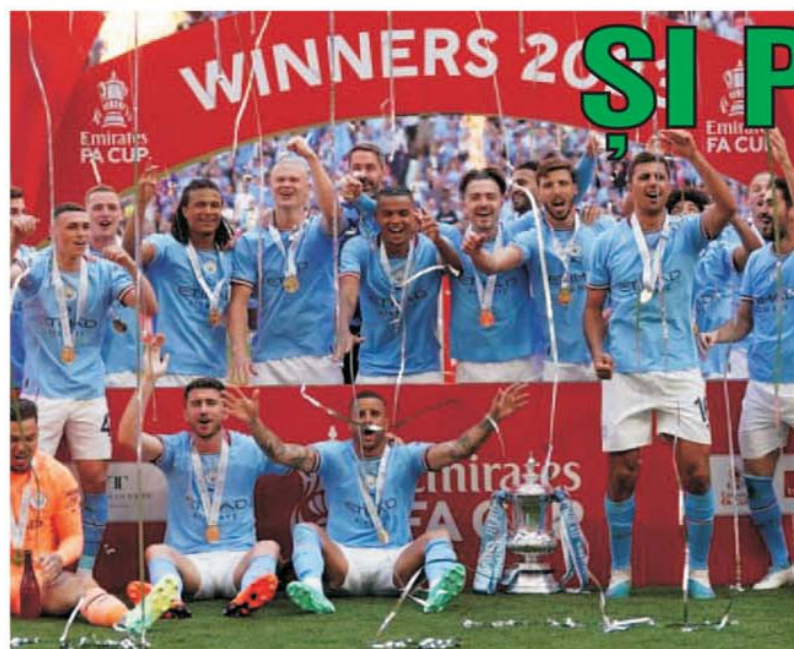
Manchester City mai este la un singur trofeu de a reuși tripla campionat - Cupa Angliei - Champions League, să egaleze performanța vecinilor de la United din 1999. City a cucerit Cupa Angliei, 2-1 în finala cu United.