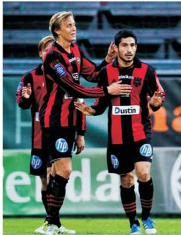
Hammarby - Brommapojkarna este un derby inedit al capitalei Suediei

loc în prima parte, mai mult ca urmare a excelentelor evoluții de afară, unde a adunat patru victorii.