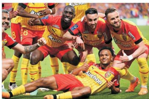
Sânge și aur la Lens pentru Champions League a fost devisa echipei care a obținut un nesperat loc 2 în Ligue 1

de euro, dar este un grup fabulos, cu o mare forță a vestiarului, unde a domnit tot timpul unitatea, exact ceea ce a lipsit mai mult campioanei PSG. Alături de Lens va mai încerca să prindă un loc în grupele Champions League și a treia clasată, Marseille, dar are de trecut turul 3 și un play-off care foarte probabil va fi unul foarte greu. Toulouse a câștigat în premieră