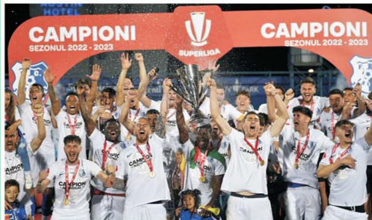
Farul lui Gică Hagi este singura echipă românească prezentă în primul tur preliminar al cupelor europene

Reprezentantele României în Conference League încep treaba direct din turul 2 preliminar. Și avem o situație rar întâlnită. Ambele echipe aproape cu același nume din Sofia, ŢSKA și ŢSKA 1948, ceva similar cu situația de la Craiova (Universitatea și FC U Craiova 1948), vor avea în față obstacole românești. Câștigătoare al doilea