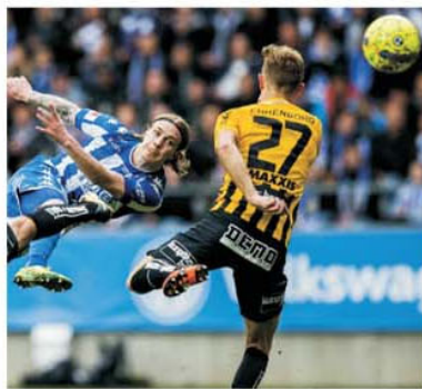
Campioana Hacken și-a revenit după începutul mai puțin reușit

Spre deosebire de vecinii norvegieni, care după meciurile din preliminariile EURO 2024 au revenit imediat în iarbă campionatului, suedezi vor relua întrecerea internă abia de la începutul lunii iulie, cu pasionanta luptă la titlu în trei Malmö - Elfsborg - Hacken. Și începe cu două partide de mare interes, Elfsborg - Hammarby și Norrköping - Hacken.