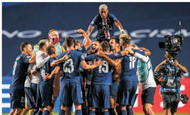
PSG continuă să fie cea mai bună din Ligue 1 chiar și atunci când este măcinată de dizarmonia din vestiar

dreptate, pentru că devine obositor să îți arăți mușchii în fața compatrioților cărora le lipsesc miliardele arabilor, iar când vine vorba de Europa să te dezumfli ca un balon. Așadar, sezonul 2022-2023 a fost unul cu finalul așteptat, titlul poposind din nou la Paris