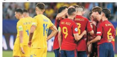
Spaniolii s-au bucurat de trei ori în a doua repriză în fața unei României fără nici un fel de reacție

doua parte a venit nota de plată, cu trei goluri, pentru noncombatul nostru. Am fost o echipă care a intrat pe teren bătută dinainte și care a așteptat resemnată venirea primului glont, după care am arătat ca un mort viu. Pe