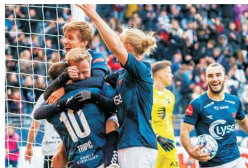
Jucătorii lui Viking se felicită după neașteptată victorie cu Brann Bergen, 3-1

Depunerea buletinelor de joc la concursul PRONO-S din 1-2 iulie 2023 se poate face începând de duminică, 25 iunie, după ora 16.00, și până joi, 29 iunie, ora 16.00. Pe buletinele de joc SE VA MARCA RUBRICA DA, MIERCURI