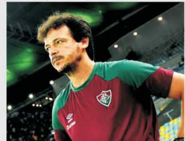
Echipa pregătită de Fernando Diniz, Fluminense, nu traversează cea mai bună perioadă

adversarei – 84,55 mil. euro față de 64,40, primii fiind Galoppo (8 mil. euro), Rodrigo Nestor (7) și Pablo Maia (6). Alături de aceștia se găsesc doi jucători cu experiență în Europa, Jonathan Calleri (29 ani; Las Palmas, Alaves) și Pato (33 ani; Milan).