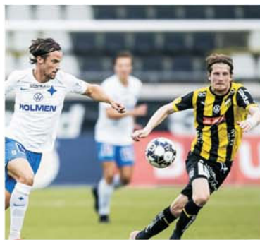
Campioana Hacken merge la Norrköping, unde a avut mereu meciuri grele în compania echipei locale

Norrköping – Hacken este o partidă din cadrul etapei a 13-a din Allsvenskan, prima divizie a fotbalului suedez.