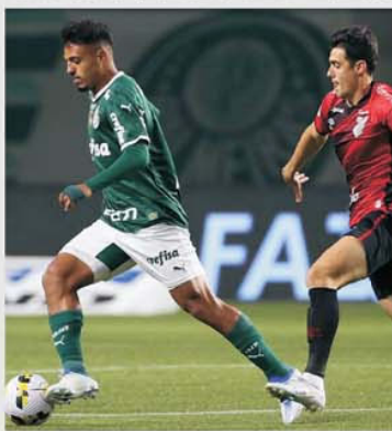
Un meci Athletic Paranaense – Palmeiras a fost mereu un spectacol de bună calitate, chiar dacă nu s-au marcat multe goluri

Partida Athletic Paranaense – Palmeiras are loc duminică, 2 iulie, în cadrul etapei a 13-a din Serie A braziliană, și reprezintă unul dintre meciurile la vârf din această rundă. Athletic Paranaense este cea mai importantă echipă din Curitiba, cea de-a doua purtând chiar numele