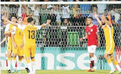
Victoria Moldovei asupra Poloniei a constituit "bomba" zilei de marți, 20 iunie