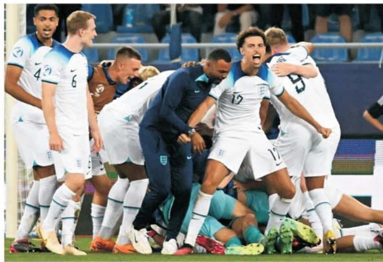
Bucurie de nedescris pentru leii Angliei, câștigători fără gol primit pe toată durata turneului final al EURO U21