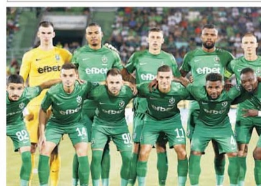
Ludogoreț e una dintre cele mai "europene" echipe din turul 1, cu 16 meciuri jucate sezonul trecut, când a trecut prin toate cele trei competiții

Comentarii și pronosticuri: Sorin DUMITRESCU