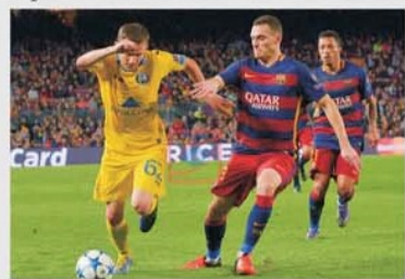
De-a lungul numeroaselor prezențe în grupele Champions League, BATE Borisov a jucat, nu o dată, și cu FC Barcelona

că nu vor putea juca acasă, în fața fanilor, declarând că au șansele lor la calificarea în turul 2 și se vor bate pentru ca să poată merge mai departe măcar încă un tur. BATE