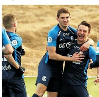
Breidablik este o formație puternică în special pe teren propriu

Breidablik – Shamrock Rovers este una dintre cele mai echilibrate partide ale concursului. Se înfruntă campioanele Islandei și Irlandei,