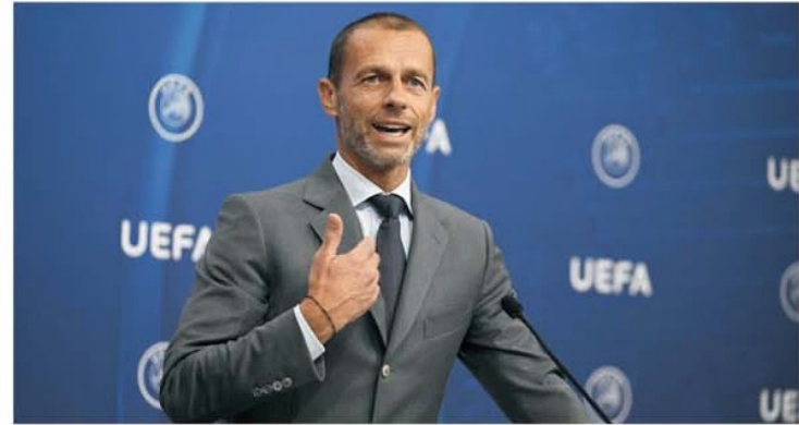
Aleksandr Ceferin, magicianul din fruntea UEFA, care vrea să strice Champions League numai de dragul petrodolarilor

ediția 2023-2024 noul format al competiției, unul evident favorabil bogaților. Numai că inovatorul șef al fotbalului european nu vrea să se oprească aici. Caută să inventeze ca în alte sporturi varianta