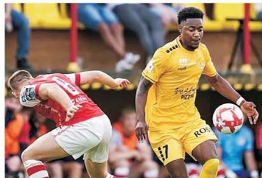
Duel la balon în primul meci din noua ediție Conference League, F91 Dudelange - St Patrick's Athletic 2-1

Comentarii și pronosticuri: Sorin DUMITRESCU