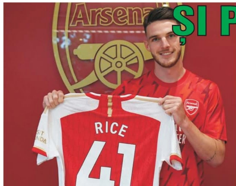
Mijlocășul lui West Ham, Declan Rice, devine cel mai scump jucător din istoria Premier League, 123 de milioane euro cu bonusuri cu tot, odată cu transferul la Arsenal