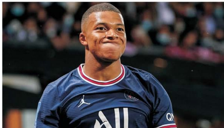
Kylian Mbappe să joace de-a șoarecele cu pisica pentru a evita acum plecarea de la PSG până vara viitoare, când ar pleca la parametri zero

atinge scopul dublu, transfer pe mulți bani cel mai probabil la Real Madrid și o lovitură teribilă dată