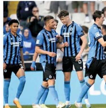
Belgienii de la Club Brugge au coborât din grupele Champions League în turul 2 preliminar al Conference League

Spre sfârșitul anilor secolului trecut și primii zece ani din cel nou Anderlecht Bruxelles a fost standardul fotbalului belgian în Europa. În ultimul deceniu polul de putere s-a mutat în ceea ce este numită Venetia Nordului, adică la Brugge,