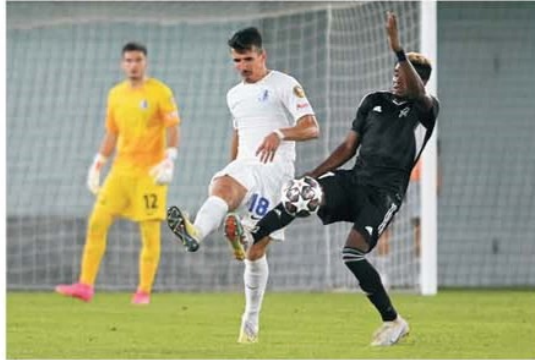
Jucătorii lui Sheriff au fost cu un pas înaintea celor de la Farul

minutul 51, după ce Alibec a scăpat singur spre poartă. Atacantul Farului i-a pasat în