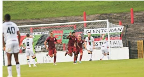
Cel mai ciudat gol marcat din lovituri de departajare în istoria Conference League

ute și exact aproape de fluierul final gazdele au egalat. În cele două reprize de prelungiri nu s-a mai înscris și calificarea s-a decis de la punctul cu var, unde s-a executat un număr record de 28 de lovituri de departajare, un alt record fiind faptul că primele 27 au fost toate transformate! Dar cireașa de pe tort a serii, un moment unic în istoria competiției a avut loc la a 23-a lovitură, executată de gazde. Portarul maltez a parat și nu s-a mai uitat după minge, luând-o la fugă, să