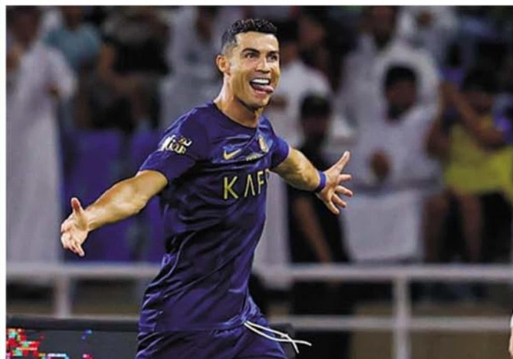
Cristiano Ronaldo (Al-Nassr) îi așteaptă cu brațele deschise în Arabia Saudită pe foștii rivali din Europa

pierdut locul de titular în poarta echipei londoneze și a preferat să lase fotbalul european la doar 31 de ani. Tot Chelsea l-a trimis în Arabia Saudită și pe Kalidou Koulibaly. Fundașul central a petrecut un singur sezon la Chelsea, în care a avut evoluții oscilante. Senegalezul s-a transferat la Al-Hilal. Un alt jucător important semnat de Al-Hilal în această perioadă de mercato este portughezul de la