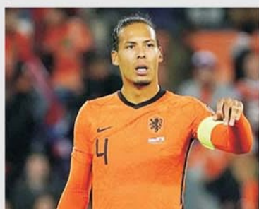
Virgil van Dijk trebuie să readucă încrederea în forțele proprii ale "Portocalei mecanice"

Naționala olandeză a disputat două partide în preliminarii, cu