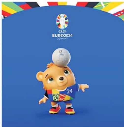
Ursul Albärt este mascota turneului final

12.09 Belgia - Estonia 12.09 Suedia - Austria