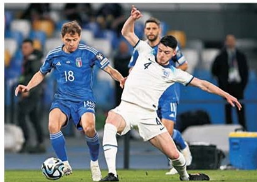
Anglia a învins Italia în primul meci din grupa preliminară chiar acasă la Azzurri și vrea să realizeze acum un bis