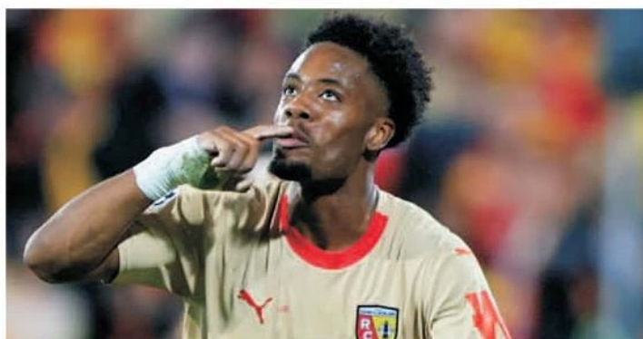
Lens a produs una dintre marile surprize în Champions League, învingând pe Arsenal

terenul lui Antwerp. În această a doua rundă a cupelor europene nu poți trece peste performanța obținută în Europa League de către câștigătoarea Conference League a ultimei ediții, echipa londoneză West Ham United. Ciocănarii, cum sunt alinați jucătorii de la West Ham, au învins, în cel mai greu meci din grupa de Europa League, pe terenul echipei germane Freiburg și au devenit astfel performera la capitolul invincibilitate în cupele europene pentru un club englez, cu 17 meciuri la rând fără eșec. O performanță pe care o poate egala în etapa a 3-a campiona din