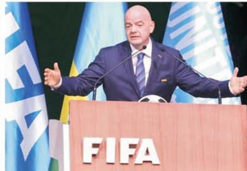
Gianni Infantino, personajul machiavelic de la conducerea FIFA, a găsit formula prin care Arabia Saudită să primească pe tavă turneul final al CM

caravana celor 48 de echipe se va muta în Peninsula Iberică și în Maroc, finala urmând a se juca la Madrid, pe stadionul lui Real, Santiago Bernabeu. Este o manevră machiavelică a lui Infantino care prin această mișcare chipurile omagiază țara primului turneu final, dându-i primul meci, dar realitatea este alta și, probabil, are în adâncuri uriașe conotații de