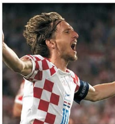
Luka Modric e Highlander din lotul Croației, dovedind că vârsta este doar un element de pe buletin

Țara Galilor - Croația este meciul vedetă al etapei a 6-a din grupa D a preliminariilor EURO 2024, grupă în care, deși a jucat