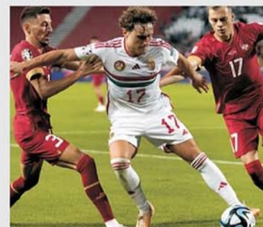
Ungaria a învins Serbia în primul meci direct din preliminariile EURO 2024 pe stadionul din Belgrad, dar fără spectatori

jocul va fi găzduit de marele stadion Ferenc Puskas. Ungaria are rezultate notabile de câțiva ani, de când selecționar este italianul Marco Rossi, cel care a calificat echipa la turneul final al EURO