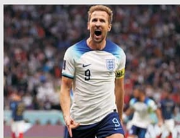
Harry Kane mai are un singur gol pentru a atinge borna de 60 de goluri marcate

Venit în locul lui Roberto Mancini în luna septembrie, Luciano Spalletti are misiunea de a redresa Squadra Azzurra. Primele