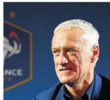
Duminică, Didier Deschamps (54 ani) a ajuns la 11 ani și trei luni pe banca echipei naționale a Franței

înfrângere din runda de debut a calificărilor. Fusesse 4-0 pentru gazdele de pe Stade de France, pe 24 martie, cu 3-0 după numai 21 de minute! Fără a avea caracterul de rivalitate, sportivă sau de orice altă natură, partidele dintre Țările de Jos și Franța au furnizat deseori adevărate spectacole fotbalistice. Zece au fost întâlnirile directe în competiții oficiale, dintre care niciuna nu s-a încheiat la egalitate! De șase ori au biruit francezii și de